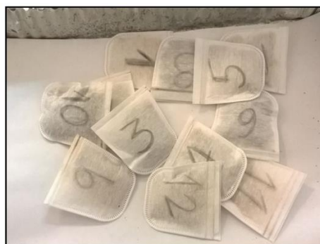
Figura 4. Bolsas Ankom con las muestras para FDN.

Para esta prueba se determinó fibra detergente neutra y fibra detergente ácido en muestras de forraje. La Fibra Detergente Neutra (FDN), se realizó por el método de Van Soest. Para ello, se pesaron 2 gr. de cada muestra, se sellaron para ser colocados en el analizador de fibra en donde se agregó el reactivo para FDN, en donde dura una hora a 100°C. Al finalizar el tiempo se lavó la muestra tres veces con agua caliente para proceder a secarlas por 12 horas a 105°C en la estufa.