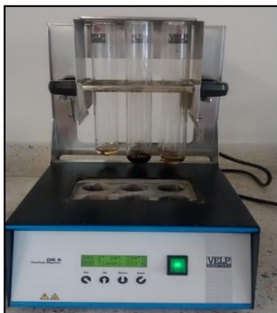
Figura 6. Digestor de proteína.

Paso 1. Digestión. Se pesaron 0.2000 g. y se colocaron en un tubo tekador (limpio y seco). Se le agregó 2g de catalizador Kjeldhal y 10 ml de ácido sulfúrico al 96%. Se introdujo el tubo en un digestor de proteína, calentándolo hasta una temperatura de 384°C