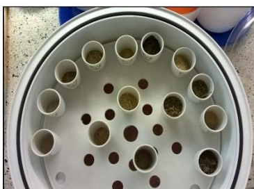
Figura 3. Muestras en crisoles.

Se tomó aproximadamente 1g de la muestra en crisoles individuales previamente pesados, estos se llevaron a secar nuevamente en otra estufa a 105°C durante 24 horas, al finalizar se sacó y se hizo el pesaje, y los respectivos cálculos para saber el peso final de la muestra y obtener la MS analítica.