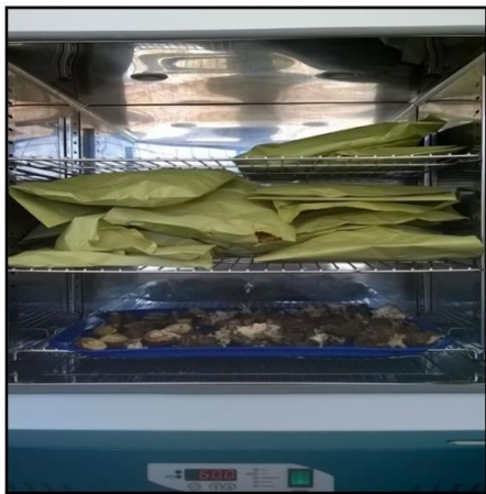
Figura 2. Muestras puestas en la estufa de secado a 60°C.

Para determinar la materia seca se sacaron las muestras de la estufa, se pesan y a esto se le resta el peso del sobre de manila. Después de esto para realizar las siguientes mediciones pasan las muestras secas por el molino para obtener partículas de 1mm, y se almacenan en tarros de plástico con tapa.