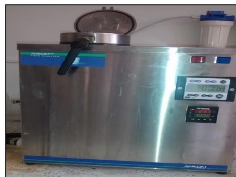
Figura 5. Analizador de fibra. Para FDN Y FDA.