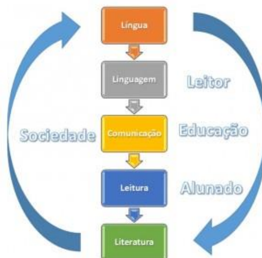
Figura 1 - Construção do Conhecimento

Uma vez que o processo de comunicação e aprendizagem ocorre dentro de um ciclo de língua, linguagem, comunicação, leitura e literatura, é imprescindível que no desenvolvimento das aulas seja utilizada a língua de sinais para o ensino dos alunos com surdez, como se pode observar na Figura 1.