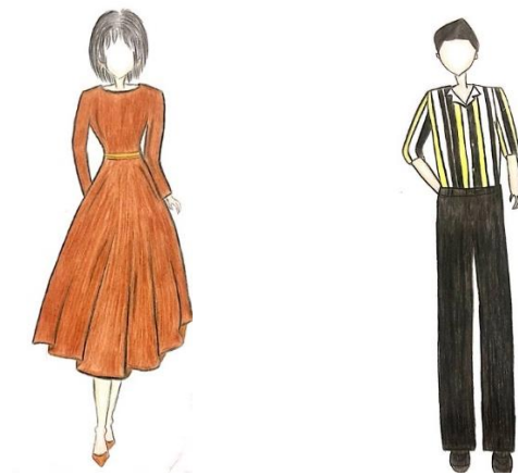
Gambar 1. Desain Kostum Norma (Desain oleh Ekel Wijayanta Pelawi, 2022)

Dalam pertunjukan teater, kostum menjadi penanda status sosial, identitas tokoh dan budaya yang melekat. Kostum dalam lakon ini juga menyesuaikan kepada selera masyarakat Medan secara aktual. Kostum yang digunakan oleh Norma adalah pakaian tunik berbahan satin delustered. Satin tersebut tampak mengkilap dan ringan digunakan. Jenis kain tersebut biasa digunakan untuk pakaian sehari-hari dan dapat memberikan kesan mewah kepada yang menggunakannya. Kostum yang digunakan Roy dalam lakon ini adalah kemeja strip dengan jenis kerah terbuka. Dalam perkembangan mode pria mutakhir ini, kemeja-kemeja yang sifatnya 'kekinian' menggunakan kerah terbuka.