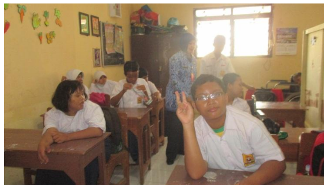
Gambar 2. Suasana Kelas VII (subjek penelitian berada dalam kelas integrasi)

Istilah yang berkaitan proses pembelajaran ABK antara lain normalisation , integration , mainstreaming , dan inclusion . (1) Normalisation merupakan konsep hukum sosial yang menyatakan bahwa normalisation merupakan dasar kebijakan dalam pendidikan khusus sebagai sistem sekolah. Prinsip-prinsip normalisation menyarankan bahwa semua