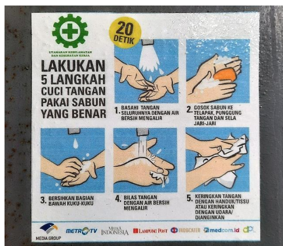
Gambar 1. Poster Infografis Bagaimana Cara Mencuci Tangan yang Benar Menggunakan Sabun dan Air Mengalir Sesuai dengan Protokol Kesehatan Ada di Kawasan Media Group

Gambar 1 di atas adalah poster infografis tentang tata cara mencuci tangan dengan menggunakan sabun dan air mengalir, dapat dilihat metode visualisasi dari infografis tersebut dengan menggunakan ilustrasi sebagai penggambaran visualnya yang disertai teks caption sebagai penjelasan di bagian bawah masing-masing ilustrasi sebagai narasi penjelasannya.