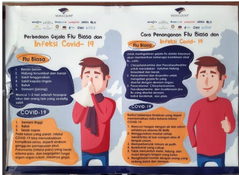
Gambar 7. Poster Infografis Perbandingan Antara Gejala Flu Biasa dan Infeksi Covid-19, Disertai Penjelasan Cara Penanggulangannya

Poster infografis pada gambar 7 di atas menggunakan jenis Comparison Infographic atau Infografis Perbandingan. Yaitu infografis yang dalam representasi grafis, membandingkan dan membedakan dua atau lebih obyek atau topik. Tata letak desainnya sering berdampingan atau memiliki beberapa kolom konten agar lebih terlihat jelas perbandingannya. Karakteristik ini memungkinkan orang untuk dengan cepat memahami apa yang berisiko, yang dapat membantu mereka membuat keputusan pembelian (O'Neill, 2021).