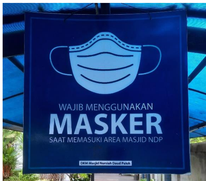
Gambar 5. Rambu/Signage untuk Menggunakan Masker di Gerbang Masjid Kawasan Media Group

jalan atau di dalam/di luar gedung. Memang kegunaan dan fungsi antara infografis dan rambu mempunyai kemiripan yaitu keduanya digunakan untuk menyampaikan pesan dalam bentuk teks/visual. Gambar 5 di bawah ini adalah contoh infografis yang berfungsi sebagai rambu (signage):