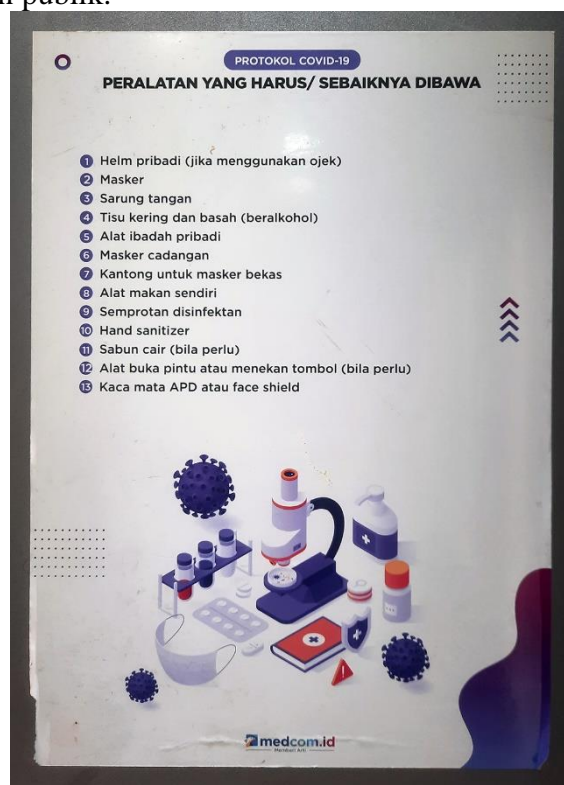
Gambar 9. Poster Infografis Tentang Peralatan yang Harus/Sebaiknya Dibawa dalam Menjalankan Protokol Kesehatan

Bila dicermati memang infografis jenis ini lebih rumit dan membutuhkan waktu untuk membaca dan menyerap isi pesannya, tetapi infografis jenis ini sangat tepat digunakan untuk menjelaskan informasi penting secara detail dan harus dimengerti setiap inti pesannya karena menyangkut kepentingan publik.