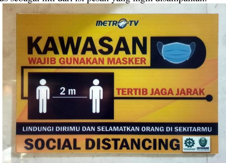
Gambar 4. Poster Infografis Tentang Aturan Protokol Kesehatan 3M yang Sesuai dengan Peraturan Pemerintah

Pada poster infografis tentang aturan protocol kesehatan 3M gambar 3 dan gambar 4, ada perbedaan gaya desain yang ditampilkan, pada poster ini visualisasinya menggunakan foto tanpa teks caption sebagai narasi penjelasan, hanya kalimat-kalimat berukuran besar sebagai judul dan sekaligus sebagai inti dari isi pesan yang ingin disampaikan.