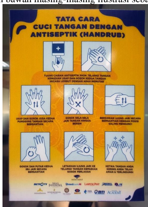
Gambar 2. Poster Infografis Bagaimana Cara Mencuci Tangan yang Benar Menggunakan Antiseptik Sesuai dengan Protokol Kesehatan

Gambar 1 di atas adalah poster infografis tentang tata cara mencuci tangan dengan menggunakan sabun dan air mengalir, dapat dilihat metode visualisasi dari infografis tersebut dengan menggunakan ilustrasi sebagai penggambaran visualnya yang disertai teks caption sebagai penjelasan di bagian bawah masing-masing ilustrasi sebagai narasi penjelasannya.