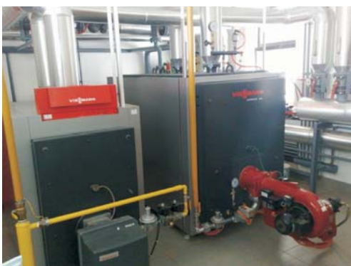
Слика 2. Постојећи котлови на течно гориво анализа потрошње фосилних горива

складу са важећим прописима и техничким нормативима, а примењени су савремени материјали мале топлотне проводљивости, тако да су мале вредности коефицијената пролаза топлоте кроз грађевински омотач објекта.