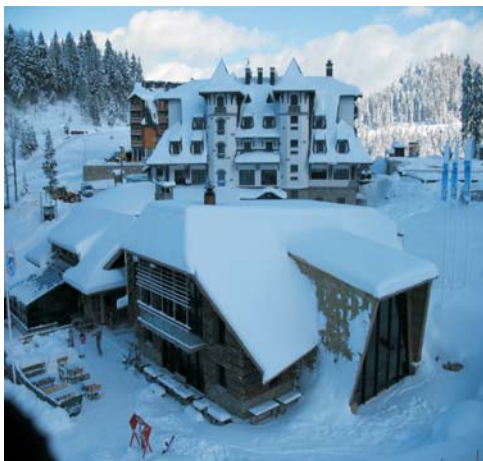
Слика 1. Хотел „Термаг” и ресторан „Колиба”