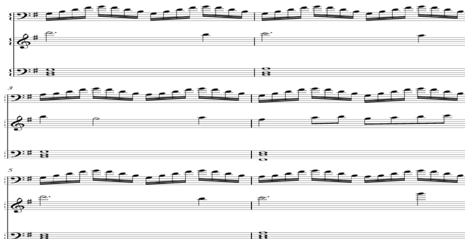
Notasi 14. Melodi, Counter melody dan kord pada bagian a'''.

Accordion . Menggunakan tempo Moderato =100 bpm dengan tangga nada 1# (G mayor) mengubah pola iringan melodi lebih rapat agar mencapai klimaks di akhir komposisi ini.