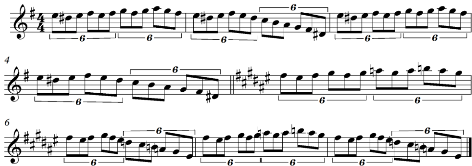
Notasi 5. Modulasi.