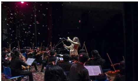
Gambar 1. Pertunjukan karya seni Rondo Ala Tungkal .