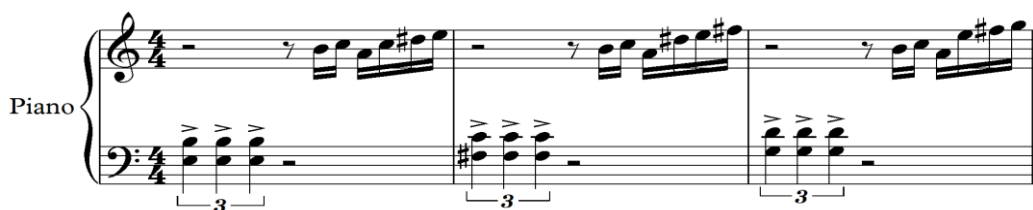
Notasi 1. Sequen.