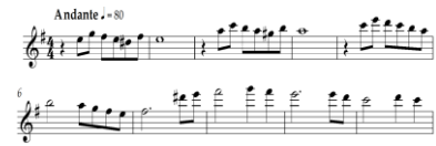
Notasi 1: Tema Pokok Lagu Nelayan

tungkal yang dijadikan tema pokok dapat dilihat pada notasi berikut.