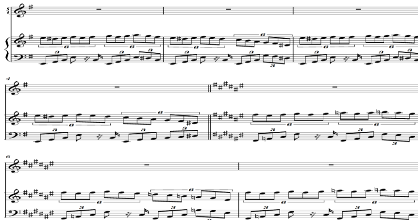
Notasi 13. Melodi pada tema b'.

yang dibawakan instrument Violin, Piano dan Marimba . Pada bagian ini juga terdapat pergantian dari sukut 4/4 ke 3/4 dan 5/4. Ketika pergantian sukut motif melodi terus dikembangkan dengan teknik repetisi dan melodi dibawakan oleh paduan suara.