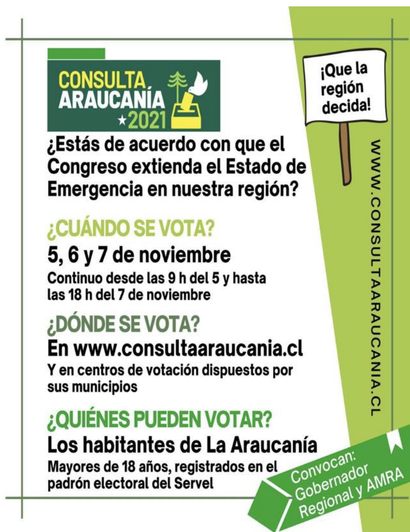
Figura 2: Lamina informativa difundida en la región

Dado que el Estado de Emergencia debía ser prorrogado por el Parlamento, los sectores afines al oficialismo de derecha organizaron una consulta ciudadana en la región de la Araucanía. La consulta fue convocada por el gobernador regional, y la asociación de alcaldes de la Araucanía (AMRA). De los alcaldes electos el año 2021, el 31,25% corresponde al pacto Chile Vamos, el 28,12% a Independiente, el 21,88% a Unidos por la Dignidad y el 18,75% a Unidos por el Apruebo.