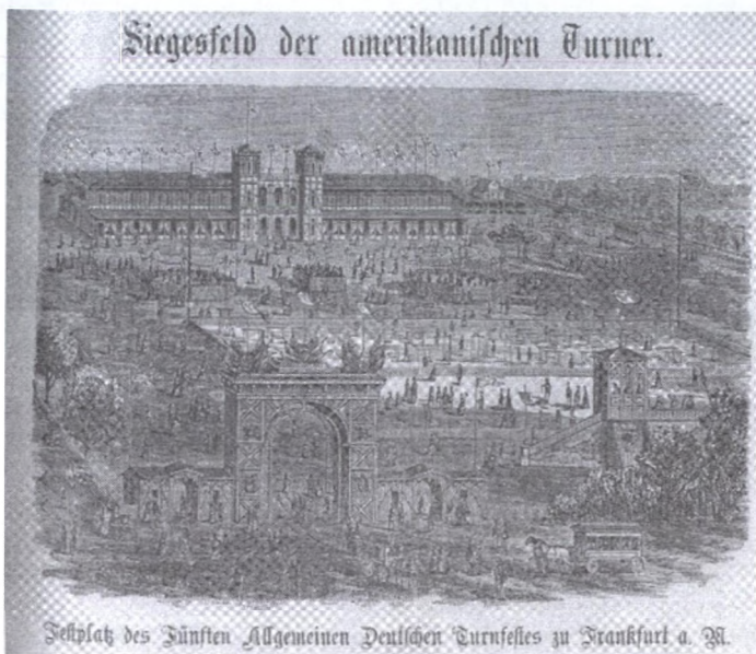
Siegesfeld der amerikanischen Turner