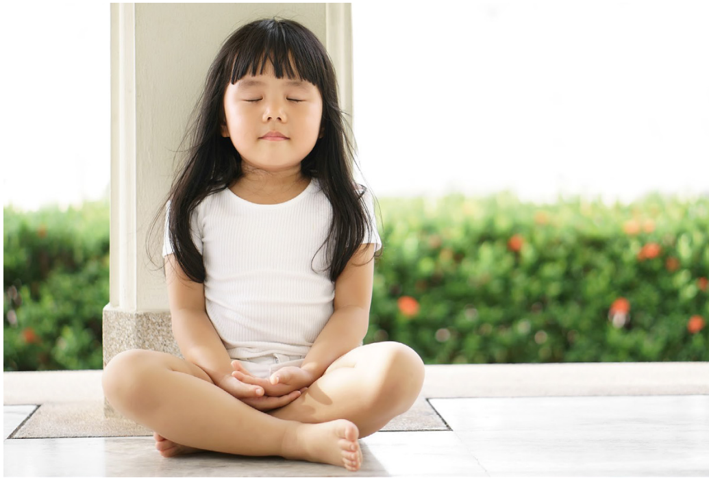
Wetenschappelijk onderzoek toont aan dat hypnotherapie een van de weinige effectieve behandelingen is bij kinderen met functionele buikpijn.