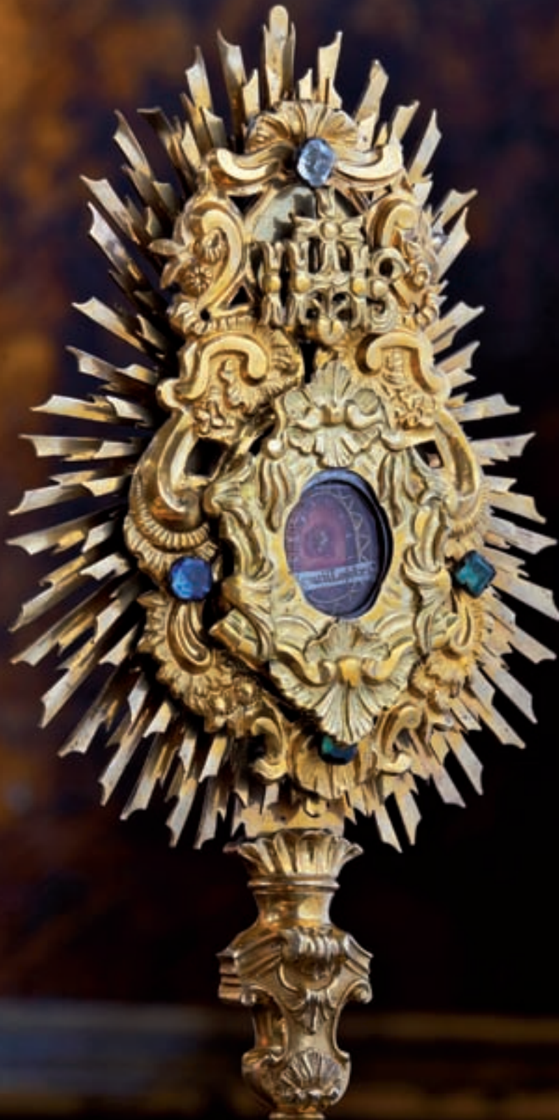
Ereklyetartó Loyolai Szent Ignác ereklyéjével Magyar, 18. század második fele