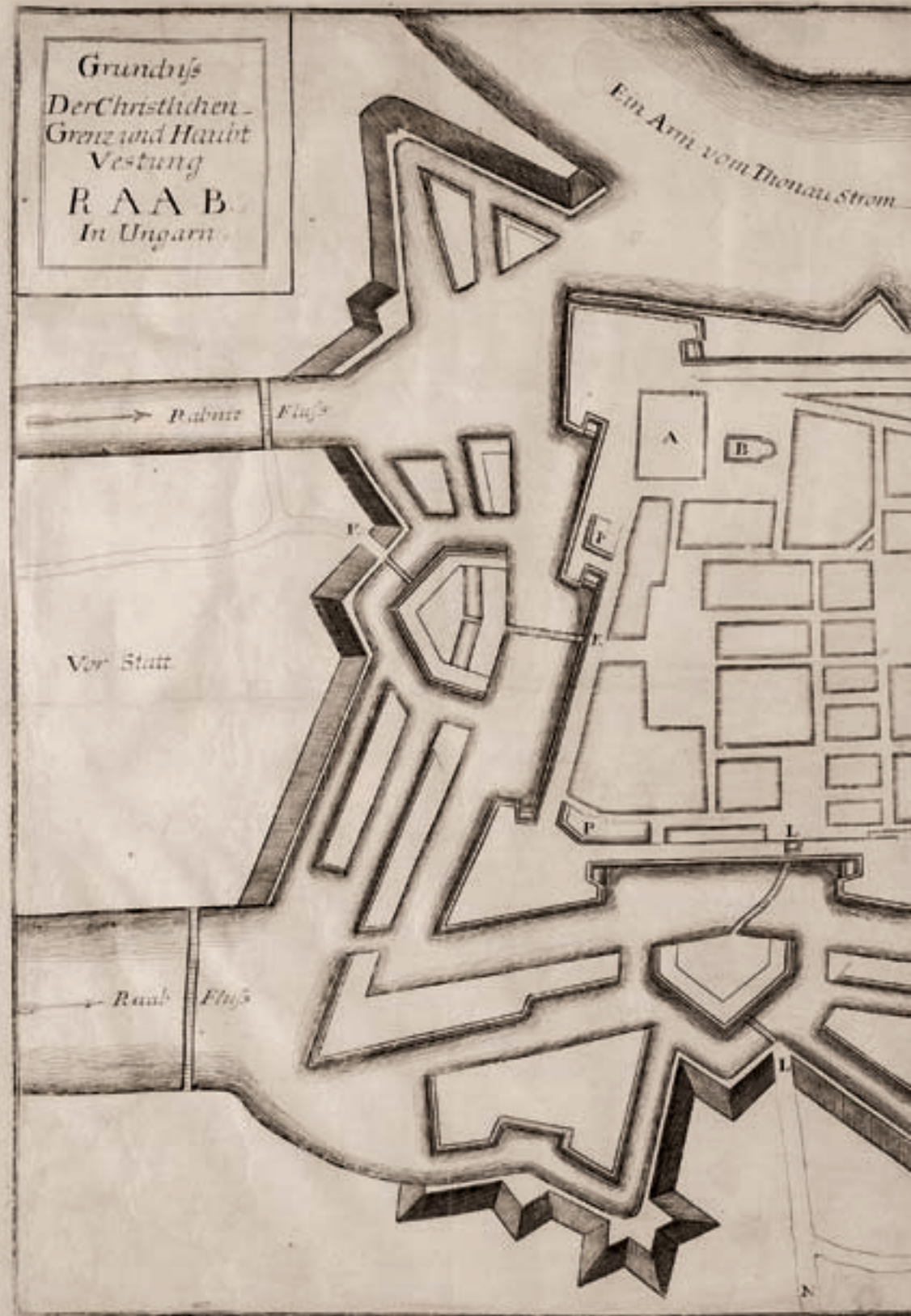
Győr mint erődváros alaprajza a 17. század közepéről