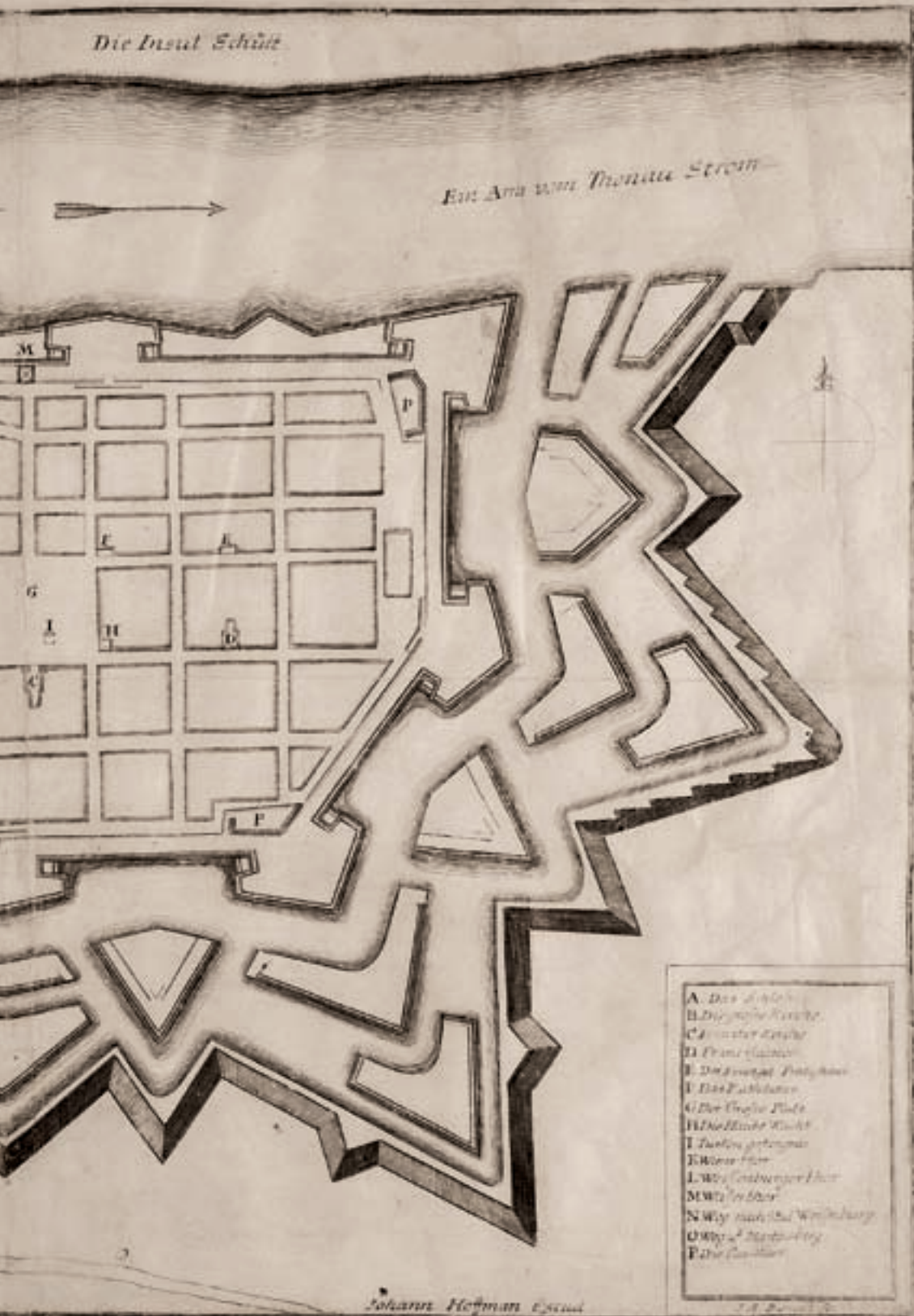
Grundriss Der Christlichen Grenz und Haupt Vestung Raab In Ungarn, Johann Hoffman rézmetszete

lépésben történt; a káptalan és a jezsuiták részéről Rumer János osztrák tartományfőnök között január 2-án létrejött, Lósy által július 18-án jóváhagyott szerződésről III. Ferdinánd is oklevelet adott ki november 8-án. Az egyezség rögzítette, hogy a káptalan az 1627 óta átadott összesen 11 telek birtokában meghagyja a jezsuitákat, akik azonban több telket, házat vagy egyéb birtokot a káptalan vagy a püspök joghatósága alatti területen nem szerezhettek. A Társaság a házak felett a káptalan joghatóságát elismeri, azokért összesen évi 5 forint 50 dénárt fizet, a püspöktől kapott győrszigeti kertért pedig 6 magyar forintot. 13