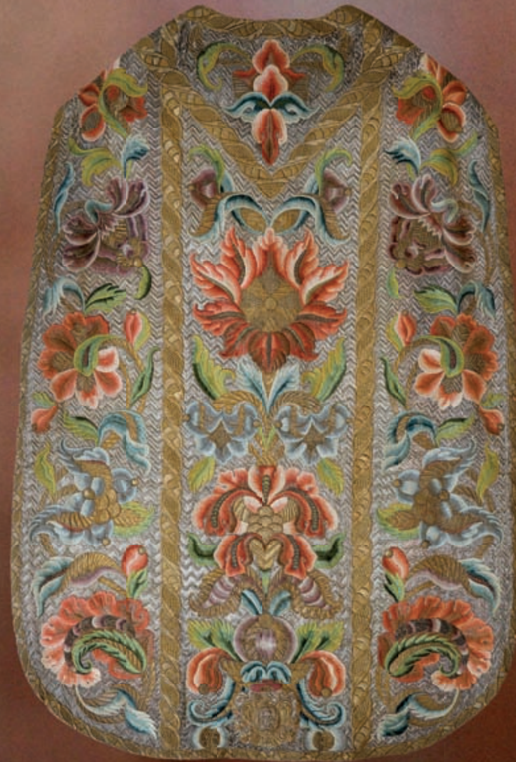
Acsády Ádám veszprémi püspök által adományozott miseruha 18. század első fele