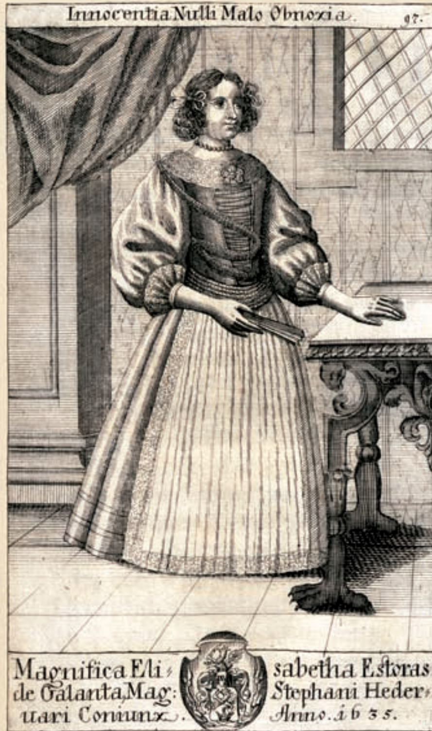
Héderváry Istvánné Esterházy Erzsébet Esterházy Pál: Trophaeum... Bécs, 1700, nr. 97.

nyozására és domborműves kiképzésére szánt adományáról emlékeztek meg a jezsuiták. 89 A templom első kialakítása, a főoltár és hat mellékoltár elkészítése tehát 1670-re zárult le.