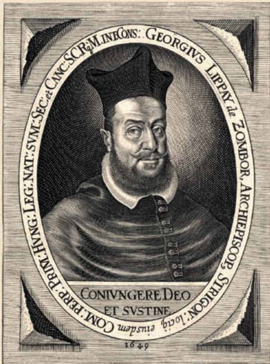
Lippay György esztergomi érsek Elias Widemann rézmetszete, 1649