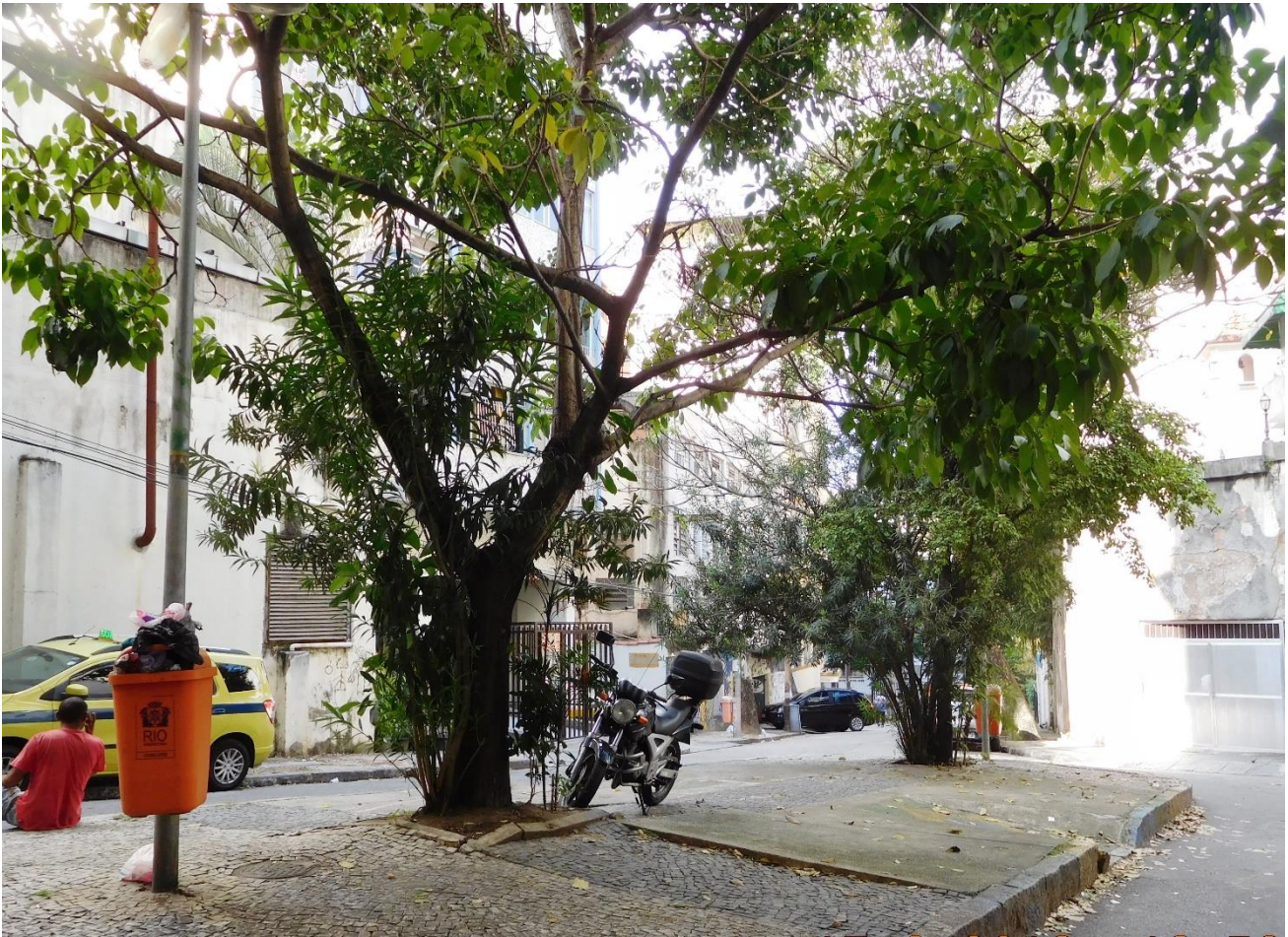
Imagen 10 – Plaza Almirante Jaceguá(10).

En otros casos la particularidad de las plazas se traduce en ser espacios públicos dentro de otros espacios públicos como la Plaza Estado da Guanabara(46) en el Largo da Carioca donde una línea de empedrado portugués en color negro advierte de la separación entre un espacio y otro que es donde, entre semana, se localizan puestos de venta ambulante (Imagen11); Plaza Monseñor Francisco Pinto(13) localizada al fondo de la Plaza Marechal Cárdenas que pasa desapercibida salvo porque aquí es donde los domingos se concentran muchos ‘habitantes de calle’ para recibir comida y ropa; y la Plaza dos Profesores(15), un tramo de la Rua Pedro Lessa que en su parte central está equipada para la permanencia, un tramo de calle con la ‘categoría plaza’ como ocurre con Monte Castelo(51) y Olavo-Bilac(52) aunque con funciones diferentes.