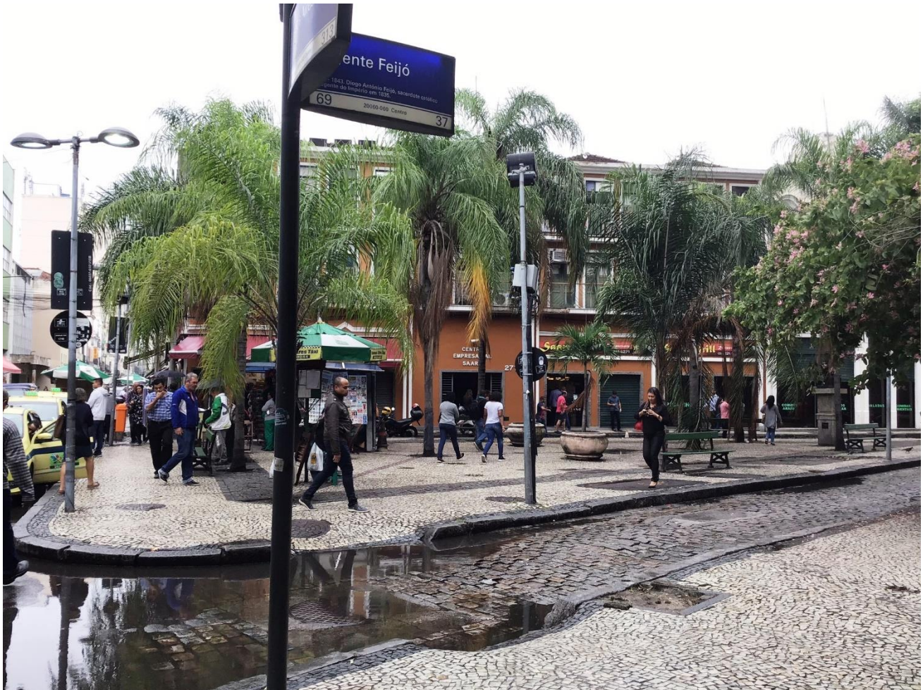
Imagen 9 – Plaza O Mascate(49).

Antônio Carlos con la Avenida Beira Mar; y Vinte e Dois de Abril(24) de la cual parte una rampa que lleva hasta la Plaza Senador Salgado Filho(25), se inaugura en abril de 1956 para homenajear la participación de Brasil en la Segunda Guerra Mundial, en su esquina un Monumento a la Paz conmemora la Conferencia ONU-Eco (Río92).