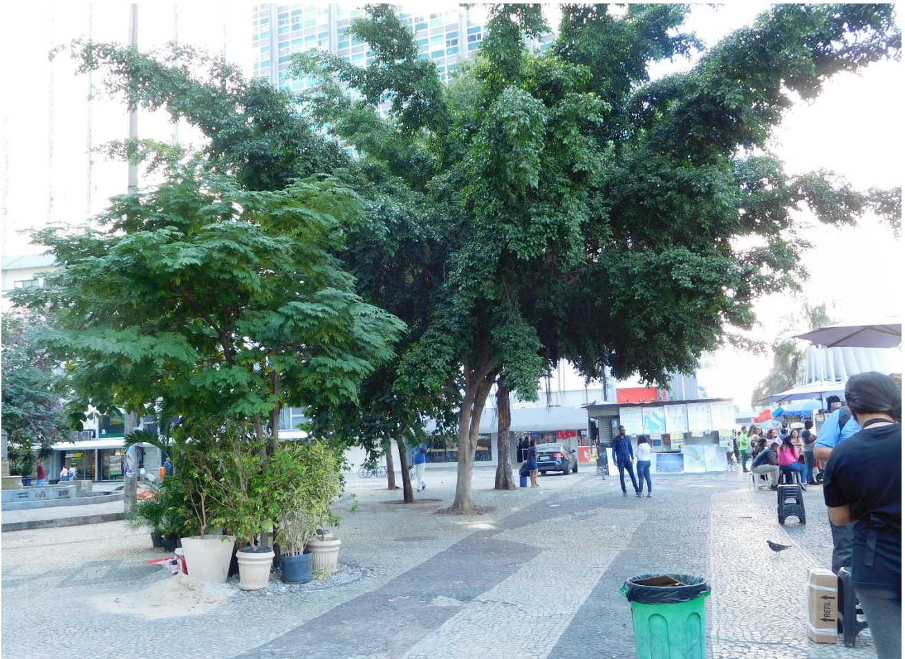
Imagen 11 – Plaza Estado da Guanabara(46).

Finalmente queda hacer referencia a dos plazas que parecen desconectadas de la trama urbana: Virgilio de Melo Franco(23) y Senador Salgado Filho(25). La primera está en el centro de una zona residencial, en uno de sus costados tiene un negocio de coches de segunda mano y es el lugar de donde parten los vehículos de clases de conducción. La segunda está situada frente al Aeropuerto Santos Dumont y su ambientación no es por los viajeros que llegan o parten, sino por los taxistas que esperan servicio en su lateral oeste, los mismos operarios del aeropuerto, los puestos de comida y el ambiente que estos generan y la presencia de ‘habitantes de calle’ que son los que frecuentan el interior de la plaza, las demás personas que se acercan a ella tienden a situarse en los lugares donde están los taxis o la zona de comida.