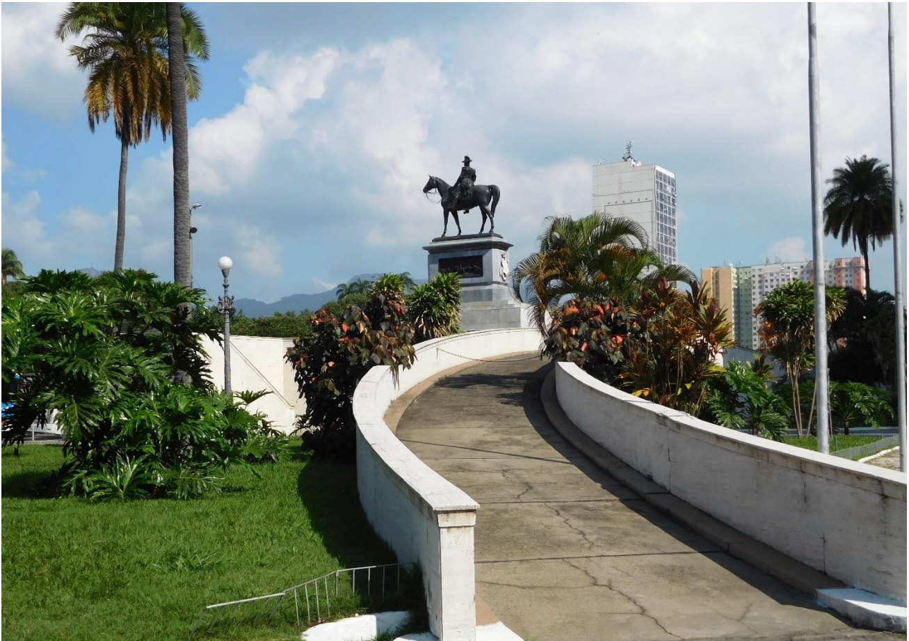
Imagen 3 – Plaza Duque de Caixas (3).

Entre las plazas abiertas (40), cuatro son puntos de movilidad, refugios intermodales en el transporte público intraurbano: Pio X(39) (Imagen4), Cristiano Ottoni(4) (Imagen5), Poeta Manuel Bandeira(20) y Estados Unidos(21). Otra plaza con función de movilidad es Da Deriva(32) (Imagen6), una infraestructura vial que discurre bajo la Avenida Presidente Juscelino Kubitschek (Elevado da Perimetral o Avenida Perimetral) y que completa en esta zona la superficie verde del frente marítimo (Imagen1). Las plazas que enmarcan la Igreja da Calandaria en su fachada principal –Barão Drumont(41)- y en la parte posterior –Da Calandaria(40)- también tienen una función de movilidad ya que su forma triangular permite organizar el tráfico, e incluso la primera es la continuidad de un paso de peatones. Esta función se comparte con la de embellecer el final del ejel .