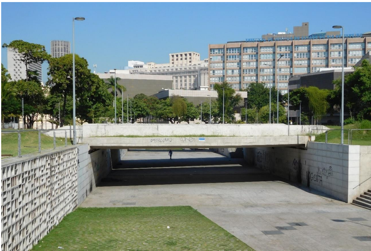
Imagen 6 – Plaza Da Deriva(32).

Las plazas de Olavo-Bilac(52) y Henrique Lage(48) tienen una función comercial y de tránsito. La primera es bastante similar a la ya comentada Monte Castelo(51), una calle transversal que conecta la Rua do Rosário y Rua Buenos Aires ocupando su parte central un comercio especializado en flores (Imagen7); y la segunda es un tramo de acera que conecta con la avenida peatonal Erasmo Braga y cuenta con pequeños puestos que desaparecen los fines de semana (Figura8a-8b).