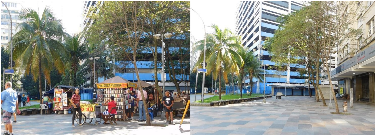
Imágenes 8a-8b – Plaza Henrique Lage(48).

Las plazas con función de ocio son un abultado número (37) donde confluyen todos los tipos especificidades. Algunas forman parte del origen colonial de la ciudad: Tiradentes(45), São Francisco de Paula(50), XV(37), Maua(43); son resultado de la gran reforma urbana : Da Cruz Vermelha(11), Marechal Floriano(14), Barão da Ladario(42), Quatro de Julho(17), Do Expedicionario(28); o completan el continuum de espacios públicos verdes que parten del Parque Aterro do Flamengo y se desarrollan a la