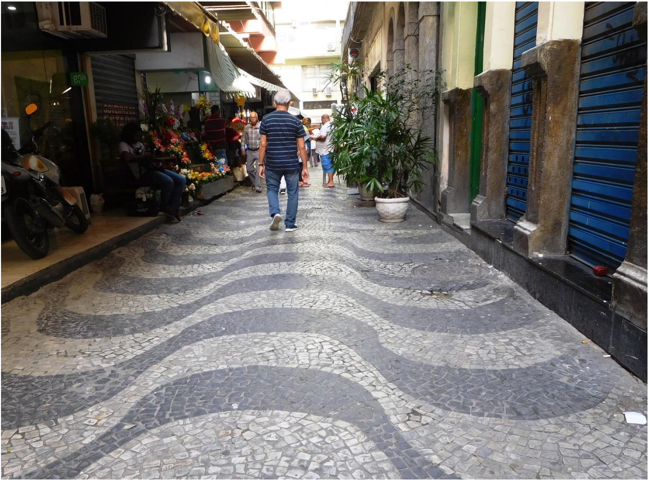
Imagen 7 – Plaza Olavo-Bilac(52).