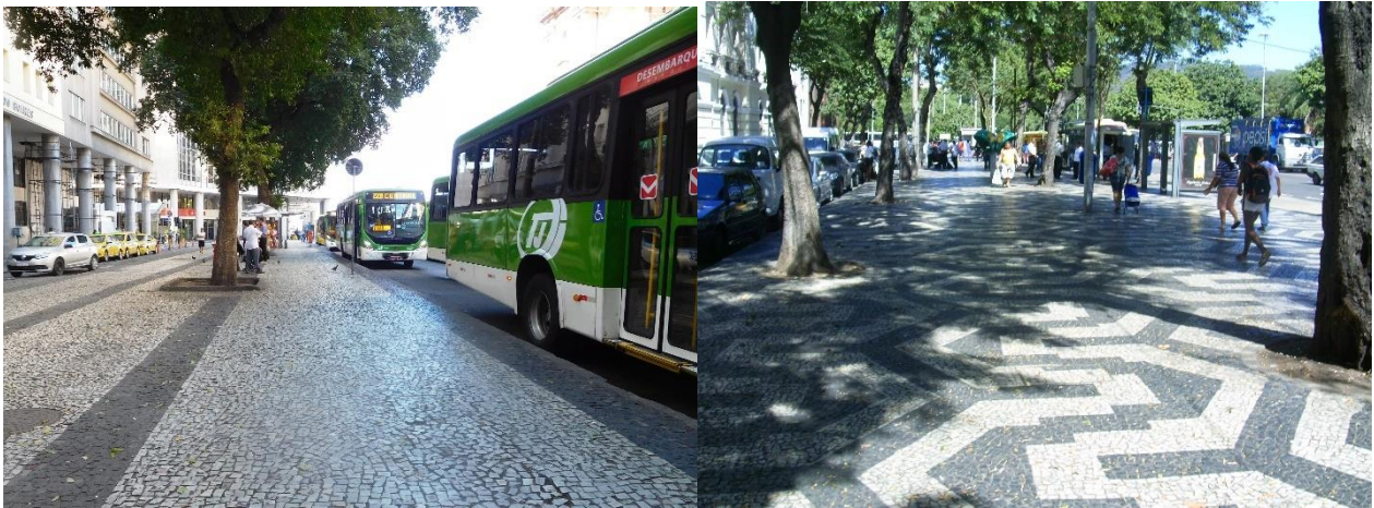
Imagens 4-5 – Plaza Pio X(39) y Plaza Cristiano Ottoni(4).