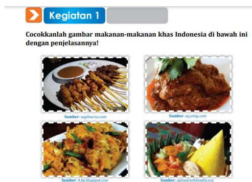
Gambar 4. Unsur Budaya Makanan Khas Indonesia

Unsur budaya yang dimunculkan dalam unit 6 adalah makanan-makanan khas yang ada di Indonesia seperti sate, rendang, bakwan, tumpeng, dan cimol.