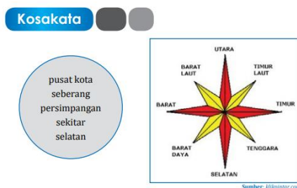
Gambar 5. Petunjuk Arah

Data yang ditemukan pada unit selanjutnya dapat dilihat dalam gambar 5.