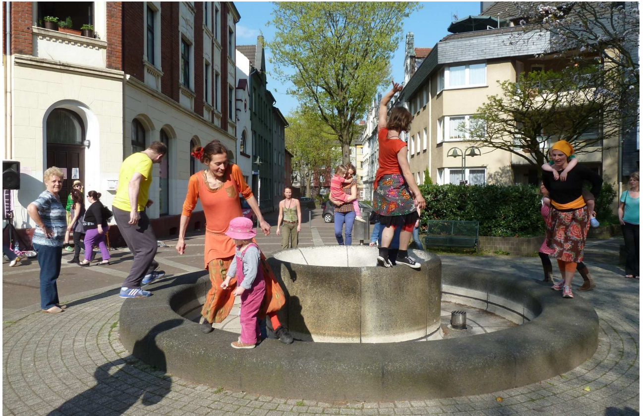
Abb. 2: Fotografie aus dem Wohnportrait „Innerstädtisches Wohnen zur Miete“

Misstände selbst fotografisch dokumentieren können und in den Publikationsprozess eingreifen dürfen, ohne für eine jeweilige wissenschaftliche Studie voyeuristisch ‚ausgebeutet‘ zu werden.