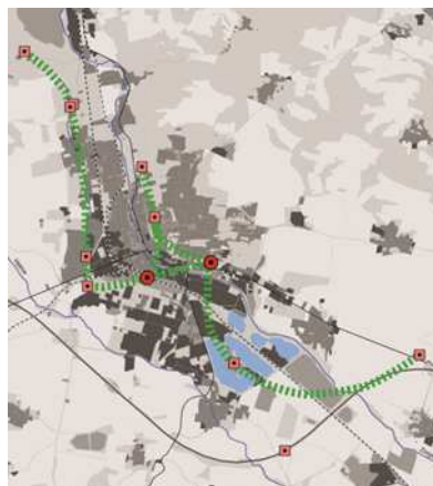
Fig. 5: Energiepfade als Raumstruktur für die Entwicklung der Energie-Kultur-Landschaft (Projektvorschlag der Hochschule Nordhausen für die IBA Thüringen, 2014).

Energieprojekte mit relevanten Energieeinsparungen und bzw. oder mit der Nutzung erneuerbarer Energien sind bisher sowohl in den Städten als auch im ländlichen Raum nur punktuell zu finden. Das Stromnetz verbindet die Anlagen regenerativer Stromgewinnung miteinander, ohne dass man die unterirdisch verlegten Leitungen sieht. Auch ohne Smart Grid können Stromgewinnung und Stromnachfrage räumlich und nachfragemäßig aufeinander bezogen werden. Ähnliche Bezüge sind bei zentralen Wärmequellen, dem Wärmenetz und der Wärmenachfrage darstellbar.