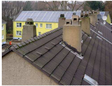
Fig. 1: Alte und neue Dächer in der Solarsiedlung Gelsenkirchen Lindenhof (Foto: Prof. Dirk Slawski, Essen).

Der Beitrag, den Eigentümer und Nutzer von Immobilien in diesen beiden Stadtraumtypen durch Energiesparen und Nutzen erneuerbarer Energien leisten können, ist durchaus relevant, jedoch kleiner als die Beiträge von Wohnsiedlungen und Gewerbegebieten der Nachkriegszeit bis einschließlich der 80er Jahre des vergangenen Jahrhunderts.