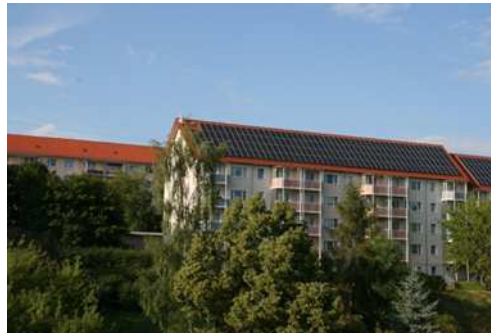
Fig. 4: Solardächer auf Geschosswohnbauten am Südhang von Nordhausen.

verträgliche Nordhäuser Solardach-Landschaft entstehen, die als Gesamtprojekt mit Beteiligung von Bürgern finanziert werden könnte.