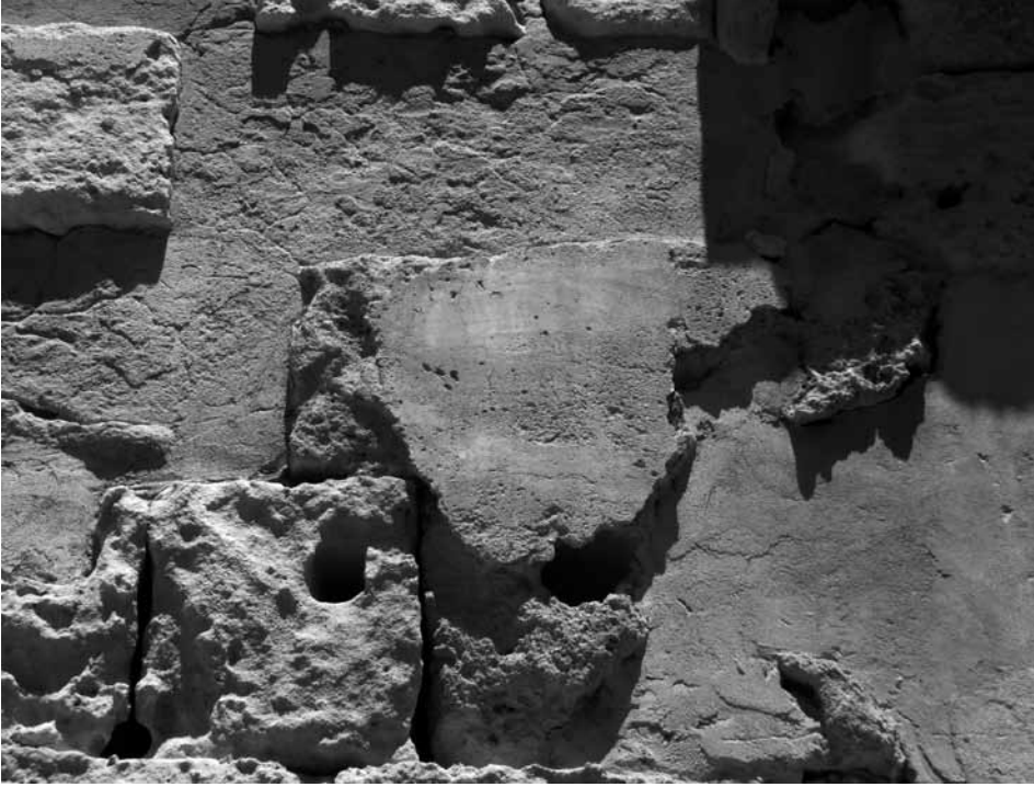
Fig. 5. Sabratha. Anfiteatro. Resti dell'intonaco che copriva le pareti del corridoio d'ingresso orientale, parete nord. Da Sud. Maggio 2012

Bisogna sottolineare come le due iscrizioni siano in pratica un unicum , fra i pochissimi esempi a me noti di tituli picti all'interno di un anfiteatro 19 con la menzione di munera . Il fatto che di norma questo tipo di iscrizioni venisse realizzata sull'intonaco, che raramente si conserva, rende di per sé in generale poco frequente il ritrovamento di queste attestazioni epigrafiche. Anche a Pompei, che ha restituito molti esempi di edicta che annunciano spettacoli gladiatori 20 , non sono attestati esempi di dediche o ringraziamenti per edizione di munera sulle strutture dell'anfiteatro. D'altra parte che i due testi di Sabratha non siano edicta sembra confermato dal fatto che la pubblicità per i giochi andava fatta nelle strade della città e non all'interno dell'edificio da spettacolo.