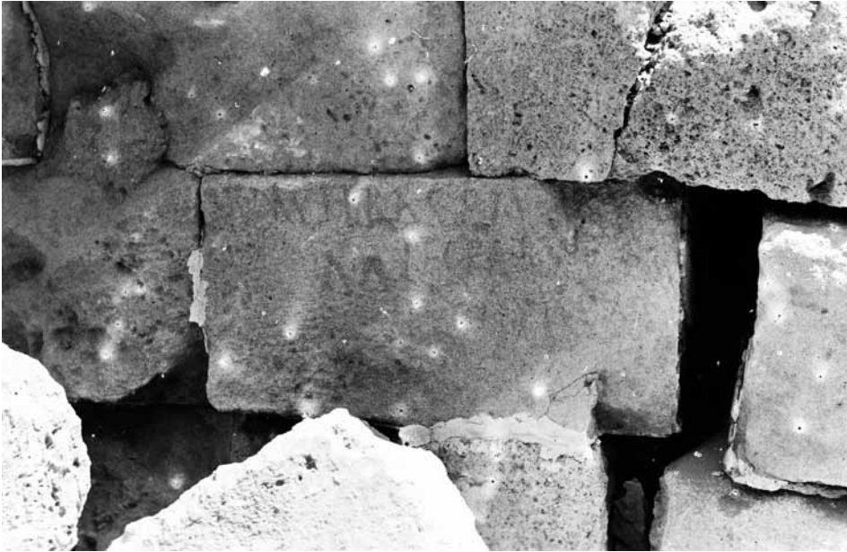
Fig. 4. Sabratha. Anfiteatro. Il titulus pictus 2 al momento della sua scoperta, aprile-maggio 1924. Particolare