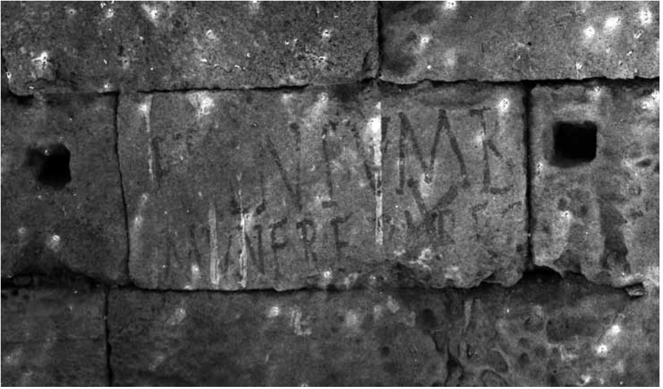
Fig. 2. Sabratha. Anfiteatro. Il titulus pictus 1 al momento della sua scoperta, aprile-maggio 1924. Particolare

numento custodite nell'Archivio CAS ve ne è una che raffigura proprio la suddetta epigrafe (fig. 2) mentre un'altra permette di capire l'ubicazione dell'iscrizione sulla parete nord del corridoio (fig. 3).