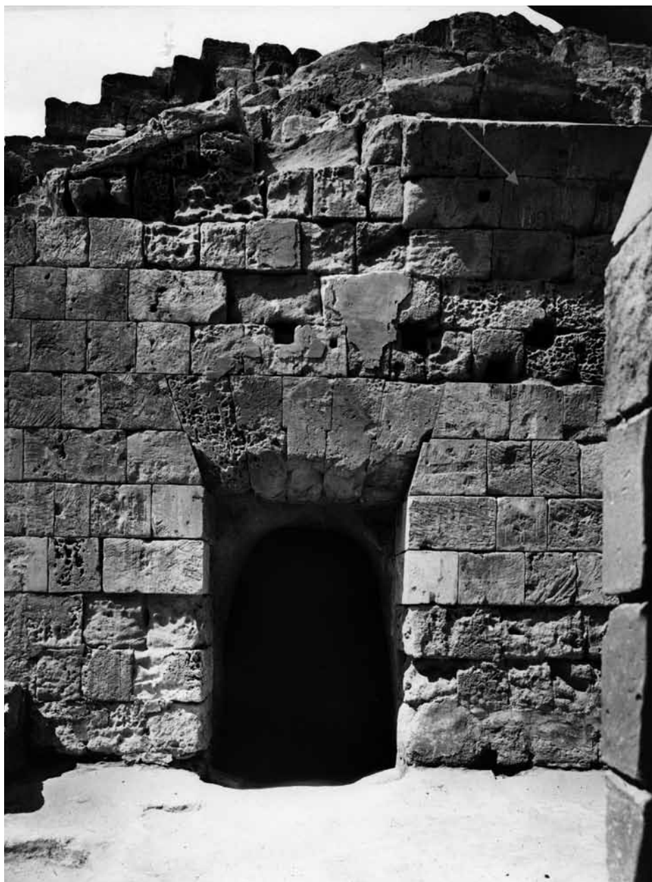
Fig. 3. Sabratha. Anfiteatro. L'ubicazione del titulus pictus 1. Parete nord del corridoio dell'accesso orientale. Da Sud.