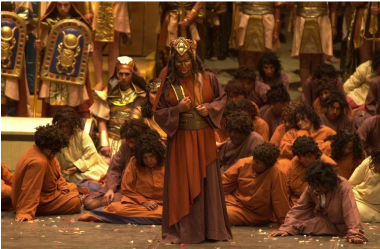
Fig.13 Schiavi etiopi (2006)

I due colori delle tuniche si ritrovano abbinati nell'abito di Amonasro che in questa edizione è caratterizzato da un trucco misto che mescola il tradizionale blackface con un rosso che ricorda la tipizzazione del personaggio così come indicata da du Locle: questo è un esempio dell'attenzione filologica generalmente espressa nelle produzioni egiziane. In tutte le rappresentazioni prese qui in considerazione, molto caratterizzate e razzializzanti, il trucco di Aida non è marcato e le vesti della protagonista sono sempre principesche, con l'azzurro o celeste come colore prevalente e corona e monili a indicarne la regalità (figure 14 e 15).