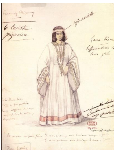
Fig. 2 Prigioniera etiope. Leggibile in basso a sinistra “peau bistrée” (immagine riprodotta in Abu Ghazala 219), segno che questa raffigurazione non comprendeva la colorazione della pelle