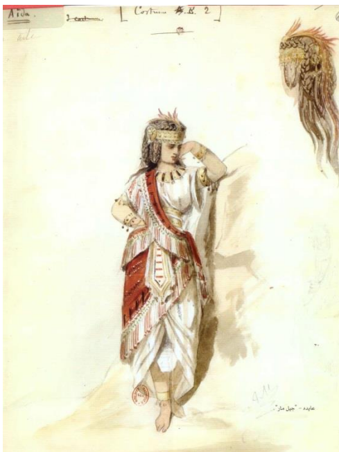
Fig. 6 Aida, disegnata da Jules Marre (immagini riprodotta in Abu Ghazala 222)

Questo è un elemento a nostro giudizio non interrogato a sufficienza da quanti si sono interessati di rappresentazione e creazione di razza al lavoro nell'Opera, ed è un elemento che assume rilievo se si considera, come si è fatto nel paragrafo precedente, l'attenzione filologica messa in campo da Mariette per l'ambientazione e la resa di ambienti e dei costumi. La filologia dell'egittologo Mariette da un lato caratterizza gli etiopi in maniera evidente dando indicazioni sul colore della pelle e sull'abbigliamento, differenziandoli sostanzialmente dagli egizi, ma dall'altro nega il colore quel colore alla principessa degli etiopi, la "celeste" Aida. Come spiegare la scelta di Mariette? Si potrebbe sostenere che Aida sia nata come un personaggio poco delineato in fatto di colore: il libretto, ovvero l'unico testo pubblico a nostra disposizione quando si parla di opera, oltre a non far mai esplicita menzione del suo colore, la caratterizza come "celeste" Aida "forma divina." La presenza di queste prime raffigurazioni di Aida come bianca può essere imputata alla diffusa