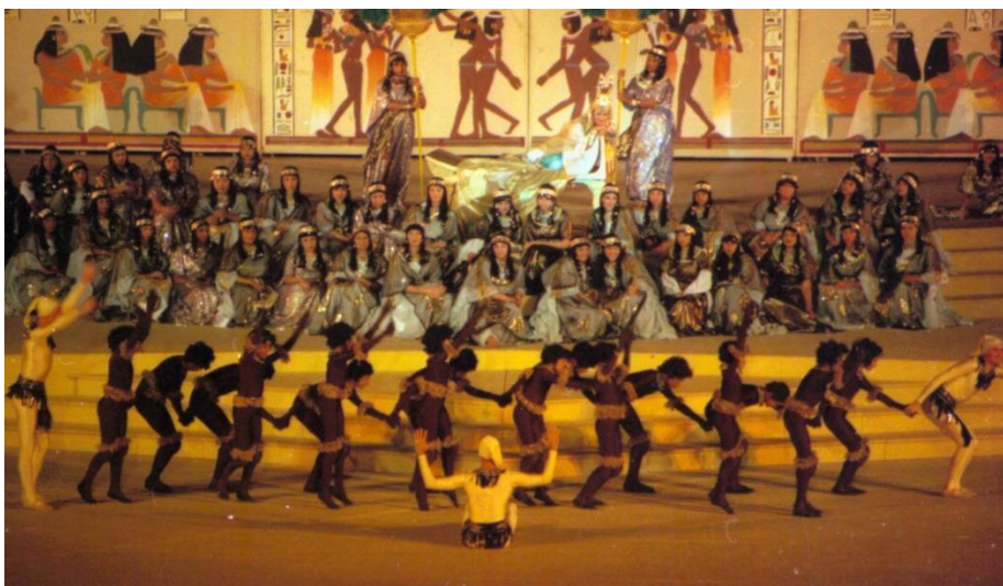
Fig.11 La danza dei moretti (1998)

La rappresentazione dei moretti (figura 11) è altrettanto rispettosa della tradizione e interpreta fin troppo alla lettera le direttive di du Locle sullo stile grottesco: i giovani danzatori indossano in stile buffonesco tute aderenti color cioccolato con paillettes ai gomiti e alla vita, abbigliamento criticato da alcuni spettatori perché definito potenzialmente offensivo (Lent).