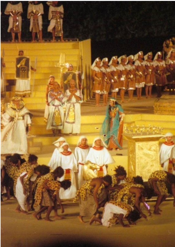
Fig. 9 Schiavi etiopi in primo piano – scena del trionfo (1998)

scomposte, fanno ingresso in scena in posizione accovacciata e non abbandonano tale posizione per tutta l'esibizione (figura 9)