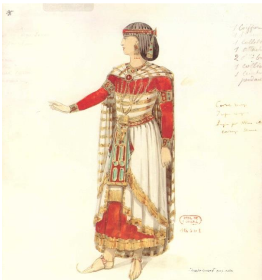
Fig. 4 Aida , disegnata da Auguste Mariette (immagine riprodotta in Abu Ghazala 199)