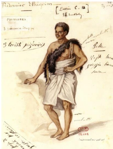
Fig. 1 Prigioniero etiope (immagine riprodotta in Abu Ghazala 214)