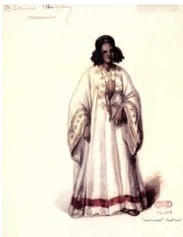
Fig. 3 Prigioniera etiope (immagine riprodotta in Abu Ghazala 218)

Come giustamente ricorda Guarracino, qui la “bianchezza” va letta nei termini di una categoria “neutra,” così come la definisce Ross Chambers, una categoria, forse la più importante, tra diverse categorie non contrassegnate (mascolinità, eterosessualità, classe media) ma non per questo meno operanti. Così come le altre categorie sopra menzionate, la bianchezza segna la “norma,” lo sfondo neutro di contro al quale altre categorie si contrassegnano e si trasformano in “differenza” (Guarracino 12). Tradotta sul palcoscenico