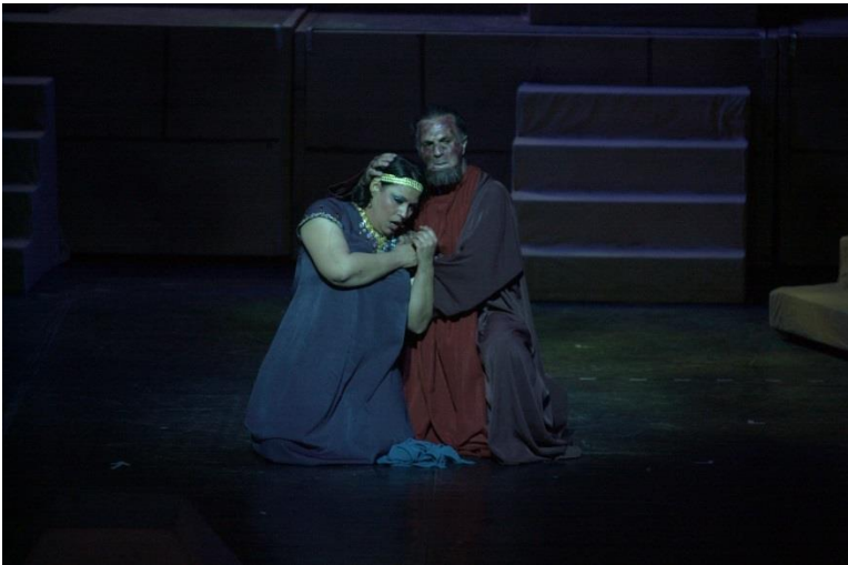
Fig.15 Aida e Amonasro (2007)

Nel 2011 A.M. Kamil ha realizzato una nuova produzione ricca di comparse e fastosa nei costumi. Tradizionalmente, è interessante notare che per le comparse (soldati egizi, sacerdoti, schiavi) vengono reclutati soldati di leva di notevole statura, perché abituati a marciare a ritmo. Questa peculiarità, lungi dall'essere una nota di colore locale, è assai eloquente del come le rappresentazioni di Aida in Egitto siano profondamente legate alle istituzioni nazionali e di come, nel complesso, tali istituzioni dettino una linea di assoluto rispetto per la tradizione, per cui la classica panoplia di vessilli, lance, feluche e bighe costituisce un accessorio irrinunciabile per le Aide egiziane.