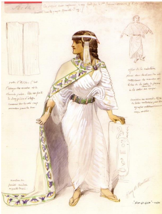
Fig. 5 Aida, disegnata da Henri de Montaut (immagine riprodotta in Abu Ghazala 228)