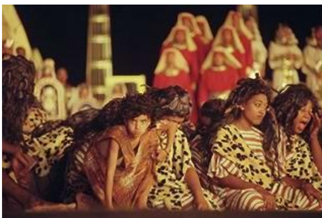
Fig.12 Schiavi etiopi (1999)