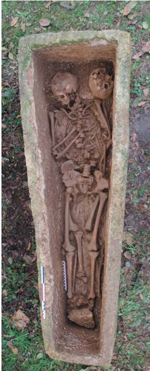
Fig. 2 – Vue zénithale du sarcophage en cours de fouille