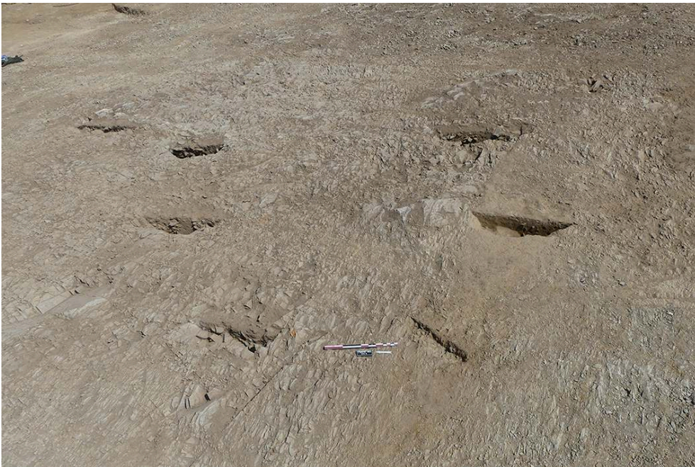
Fig. 4 – Vue générale du bâtiment central