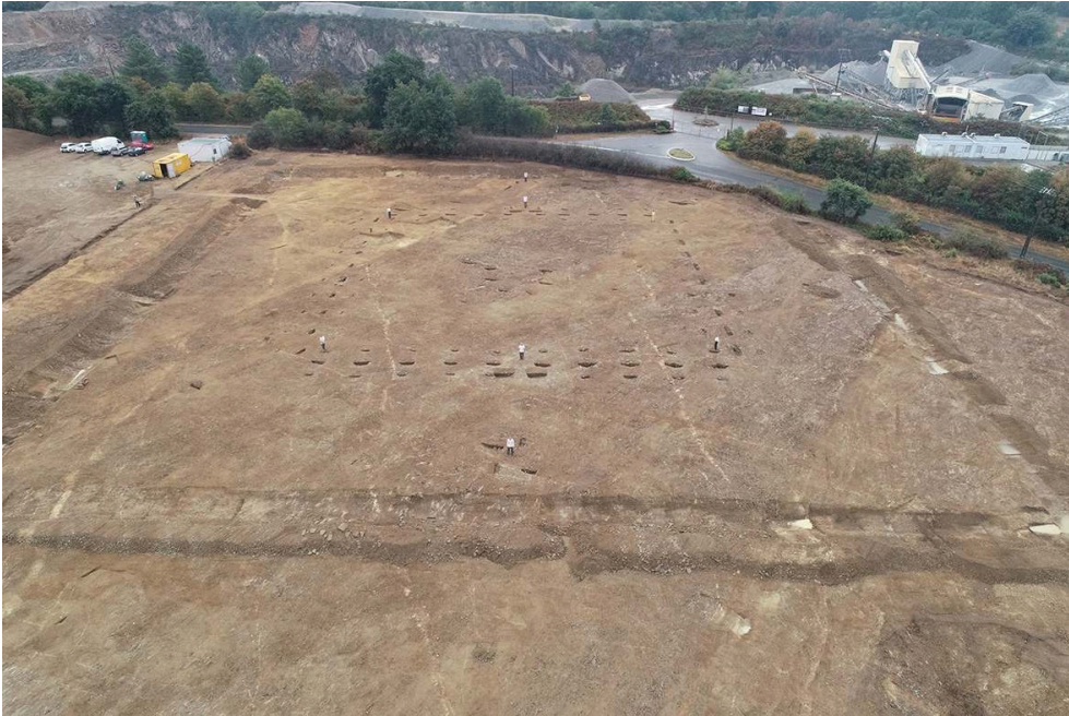
Fig. 2 – Vue générale de la moitié est de la fouille et de la carrière du Pâtis