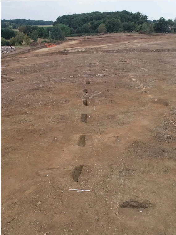
Fig. 3 – Vue générale de l'aile sud du bâtiment sur cour