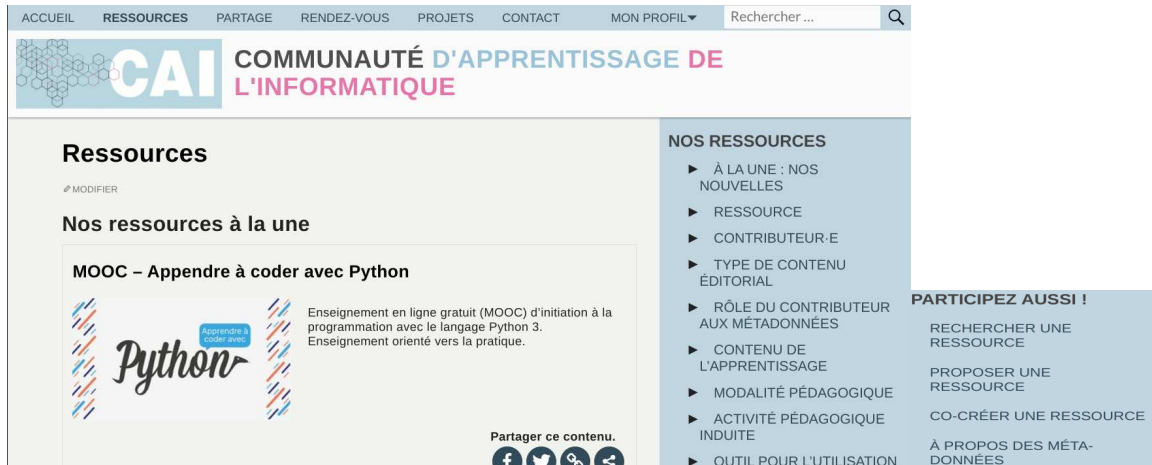
FIGURE 3. Une vue de la page de ressources, on peut rechercher une ressource par recherche textuelle, différentes métadonnées, et il y a aussi la possibilité d'une aide pour rechercher un ressource, en proposer, ou en co-créer.