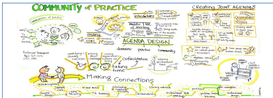
FIGURE 1. Une vue informelle des communauté de pratique : entre réseau social (ouvert et en réseau de manière coopérative et piloté par les opportunités) et équipe projet (structuré, voir hiérarchique, collaboratif et piloté par un objectifs), c'est un partage de connaissance (savoirs), de pratiques (savoir-faire) et de savoir-être; on y apprend ces compétences en "faisant" de manière incrémentale et on y crée et teste de nouvelles idées; repris de https://ctlit.ubc.ca/2013/07/25/connecting-communities-of-practice-at-ubc

On parle de partage des pratiques pédagogiques, didactiques et curriculaires sur l'apprentissage de l'informatique à l'école (10 à 18 ans). Pratiques pédagogiques comme «étant l'ensemble des actions mises en œuvre par l'enseignant durant les cours, de manière plus ou moins consciente, en vue de faire acquérir des connaissances aux étudiants et pouvant se référer à plusieurs dimensions telles que les interactions avec les étudiants, l'organisation du cours, la façon de transmettre de l'enseignant, sa clarté, le matériel mobilisé pour enseigner ou encore l'attitude de l'enseignant» (Duguet 2015).