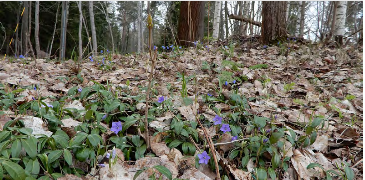
Helsinki, Kontula, Mustikkamäki, 6.5.2021 A. Kurtto

Adamec, L. 2020: Biological flora of Central Europe: Utricularia intermedia Hayne, U. ochroleuca R.W. Hartm., U. stygia Thor and U. bremsii Heer ex Kölliker. Perspectives in Plant Ecology, Evolution and Systematics 44, 125520. doi.org