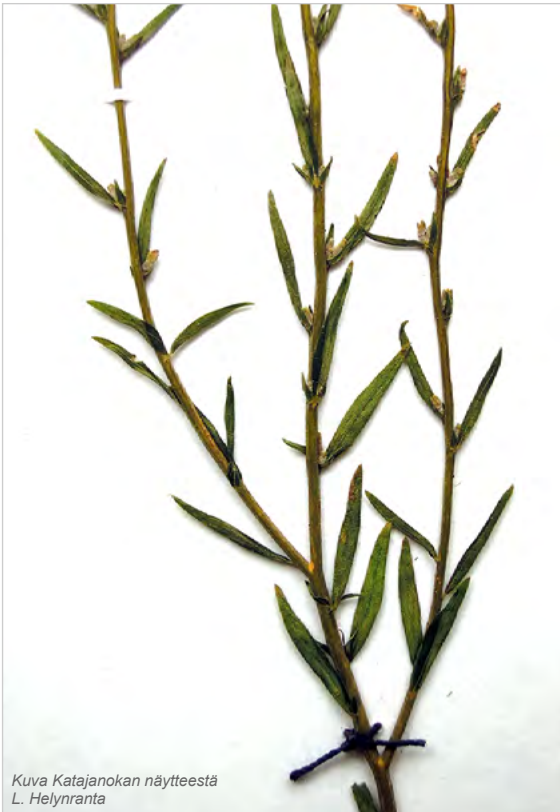
Kuva Katajanokan näytteestä L. Helyrantha

U. Lohja, Pappilankorpi, maankäsittelykentän eteläisemmät isot maakasat (6685:3340) 12.8.2021 T. Hietanen (H).