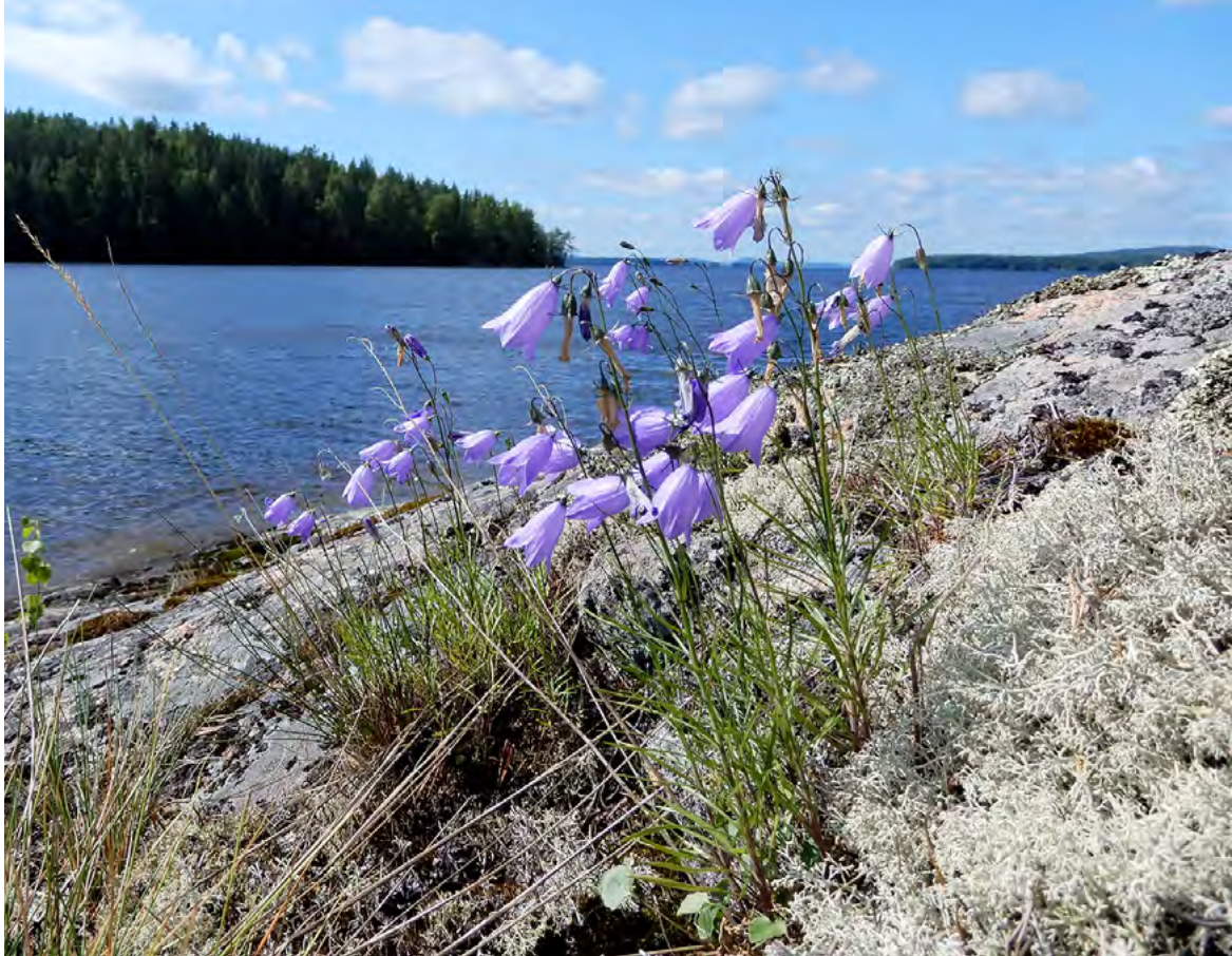
▲ Metsäkissankello, Campanula rotundifolia subsp. fennica , kuuluu Suomen alkuperäiskasvistoon harjuilla ja kalliorinteillä.

Joutsa, Rutalahden enklavi, Satokallio 31.7.2020 L. Helynranta.