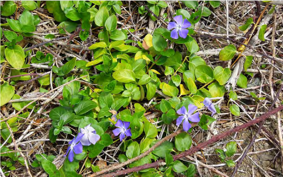
Kanariansaaret, La Gomera, Barranco de Palmita, 600 m 19.4.2016

◀▼ Isotalviota, Vinca major (yläkuva), luonnehtivat puikeat lehdet ja isot kukat. Suomessa laji ei menesty ulkona, toisin kuin kapeampilehtinen ja pienempikukkainen pikkutalvio, V. minor (alakuva).