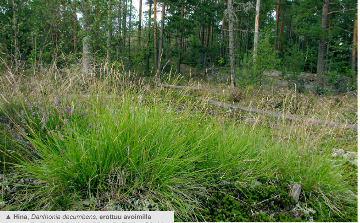
▲ Hina, Danthonia decumbens , erottuu avoimilla kasvupaikoillaan tiukkoina pikku mättäinä, vaikkakin tapaa olla niukka.

Helsinki, Östersundom, Konungskärr 18.8.2011, L Helynranta