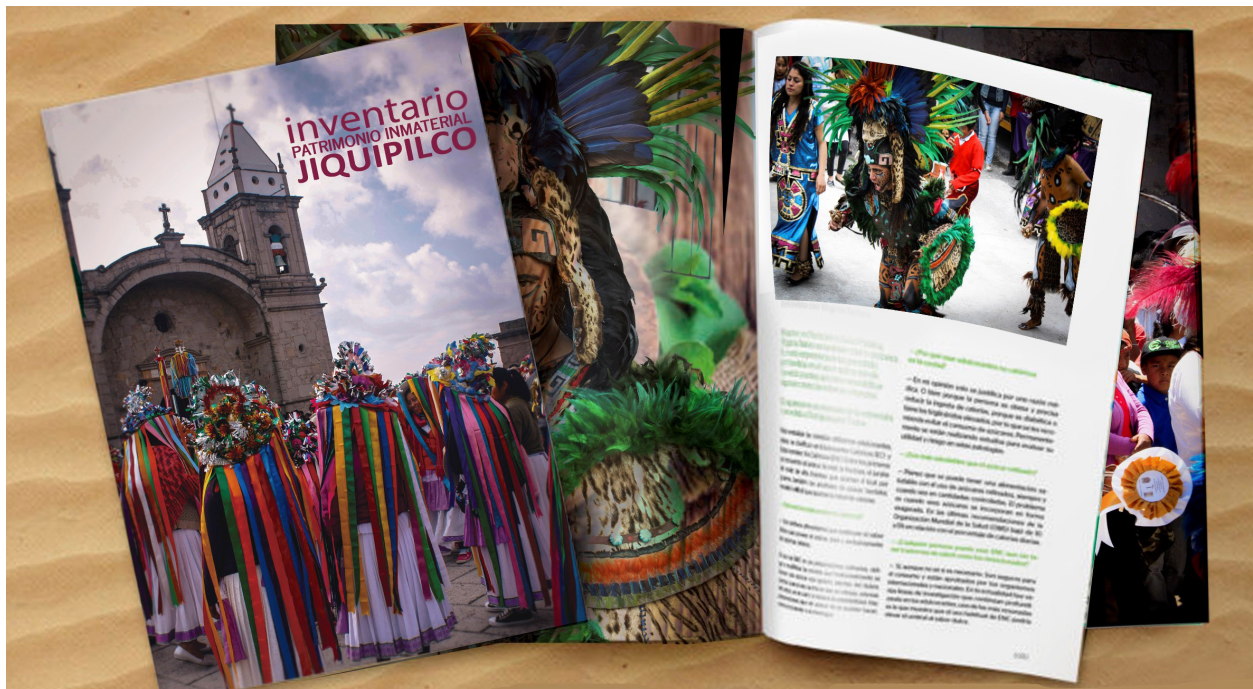
Figura 4. Inventario (Mora, 2018)

Las redes sociales se han integrado a partir de la necesidad de convivencia, afecto, economía e identidad de los individuos. Algunas de las redes que se han proyectado en la última década son con instituciones gubernamentales y académicas, con productores locales y artesanos. Estas redes incrementan las acciones de patrimonio y el fomento de identidad en el territorio de Jiquipilco.