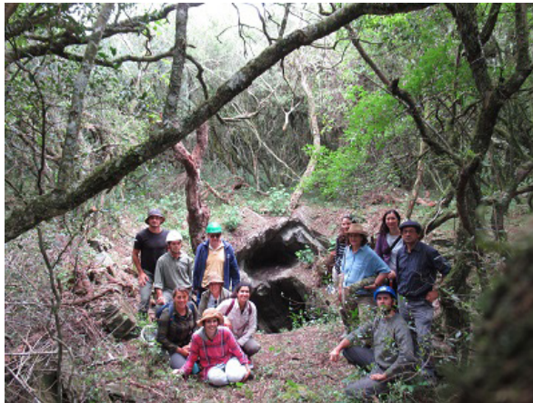
Figura 4. Participantes de salida de campo en punto de ingreso a cueva