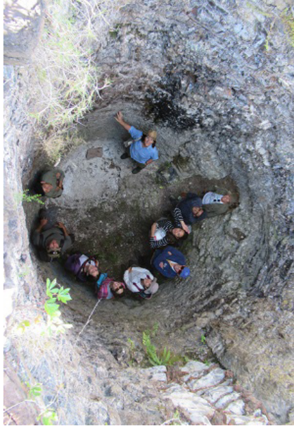
Figura 3. Visita al horno de cal ubicado en el emprendimiento Ñu Porá. Los participantes se encuentran dentro de la olla de calcinación del horno