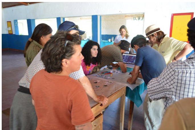
Figura 1. Participantes del taller durante las actividades de mapeo participativo