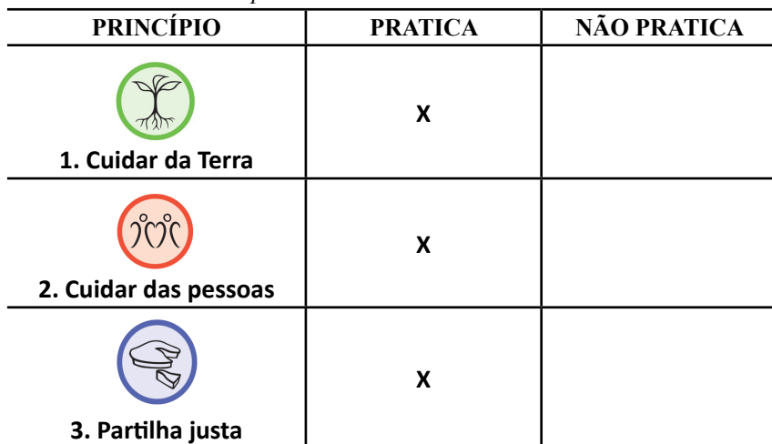
Tabela 1: Prática dos Princípios Éticos da Permacultura.

A aldeia pratica a ética “1. Cuidar da Terra” através das atividades sustentáveis, como a bioconstrução, a separação e aproveitamento de águas e resíduos e a preocupação para redução de impactos ambientais. A ética “2. Cuidar das pessoas” é percebida por meio das atividades culturais, como rituais xamânicos, yoga, dança, feiras ecológicas, alimentação saudável, música e o contato com voluntários e visitantes. Já o princípio ético “3. Partilha justa” se realiza através das atividades solidárias, o melhor exemplo dessa ética é a cozinha comunitária.