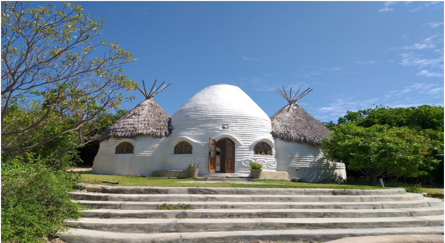
Figura 2 – Oca da Eco Aldeia Flecha da Mata.

em: tratamento das águas; em bioenergias; em costumes de alimentação comunitária, orgânica e saudável dentro dos princípios da agrofloresta; e em pensar o lixo.