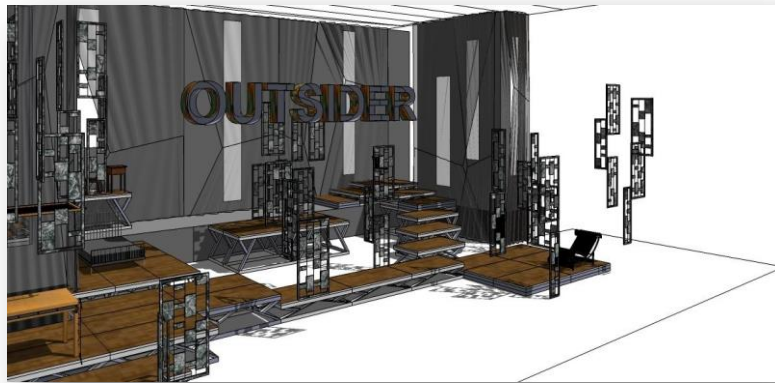
Figura 3 - Maquete virtual do cenário de Outside .