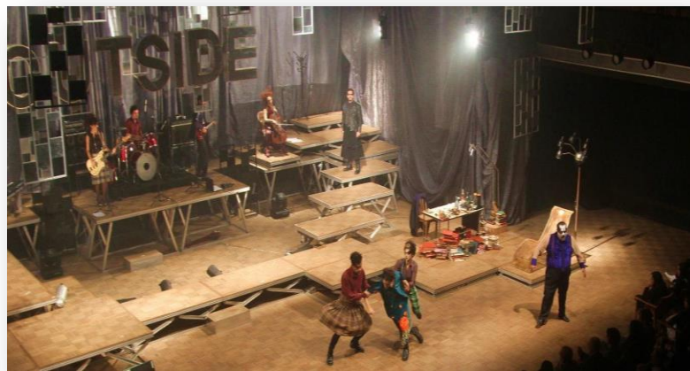
Figura 4 - Cenário, iluminação e atores vistos de cima. Outside (2011).

Nesse sentido, a concepção do cenário pode ter muitos desdobramentos em relação com a musicalidade do espetáculo, como preconizavam o suíço Adolphe Appia (1862-1928) e Vsevolod Meyerhold (1874- 1940), ambos grandes encenadores e precursores da polifonia cênica que caracteriza a maior parte das produções do teatro contemporâneo. Para Maletta: