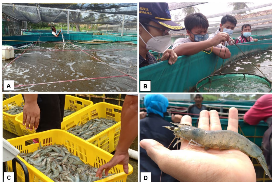
Gambar 2. Beberapa tahapan proses pemeliharaan udang vaname.

Keterangan : Huruh yang menyertai angka menunjukkan signifikansi antar dua perlakuan