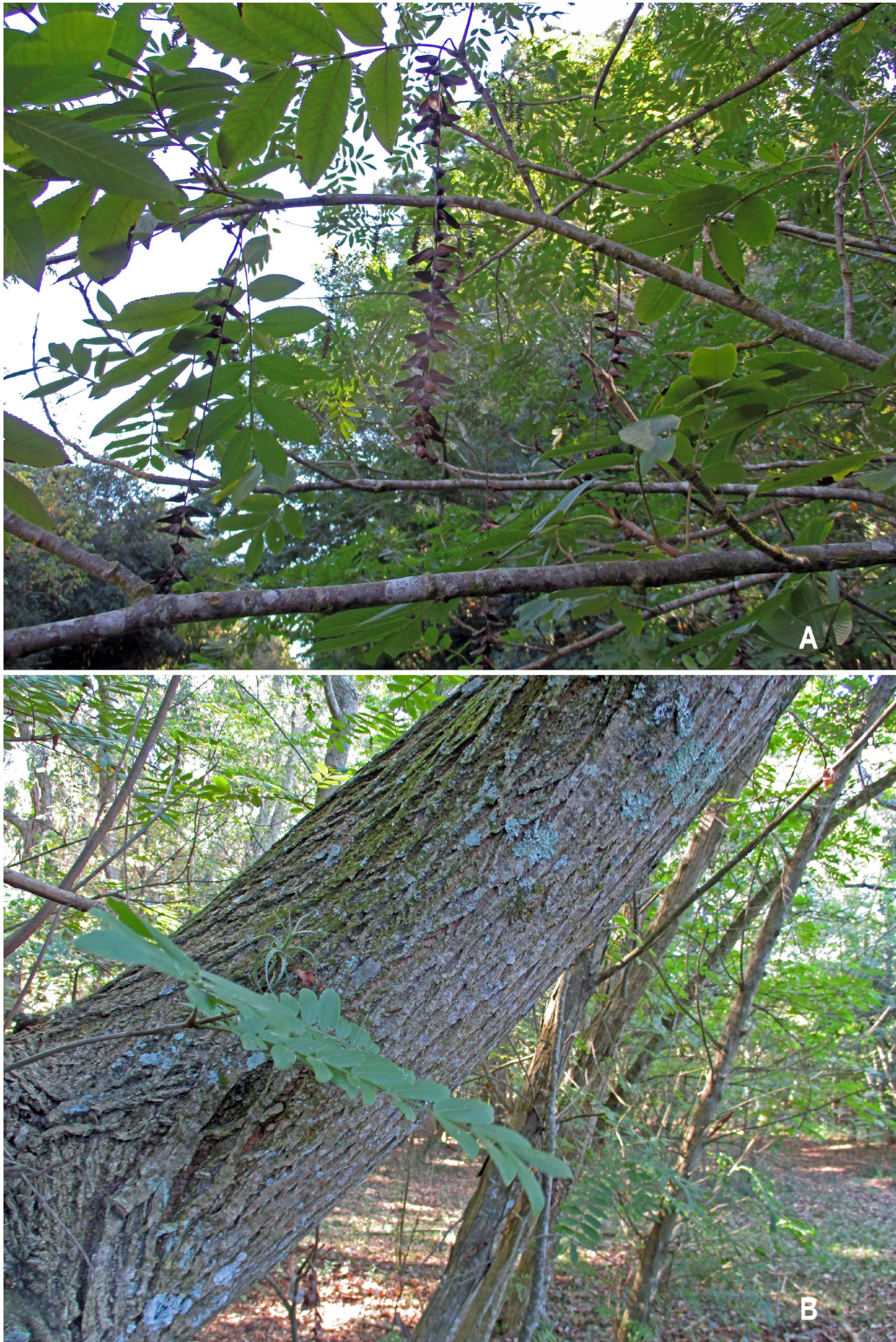
Fig. 1. Pterocarya stenoptera . A: Ramas superiores y frutos. B: Tronco. Fig. 1. Pterocarya stenoptera . A: Upper branches and fruits. B: Trunk.