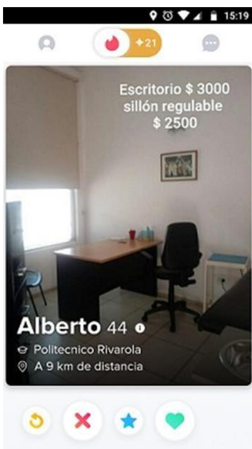
figura 5 - Usuario vendiendo muebles (2020) Captura de pantalla de la aplicación

A nivel de medios, uno de los puntos más interesantes a considerar dentro de la tétlada es el de la inversión, que nos lleva a analizar cuál es el potencial de inversión de esta nueva situación. Encontramos casos en los que Tinder fue utilizada con fines comerciales siempre rondando a la lógica amorosa. Interesados en vender sus productos, marcas reconocidas crearon sus perfiles en busca de matchear con posibles compradores (Domino's y Frávega por ejemplo), pero son también usuarios/personas quienes intentan comerciar dentro de una red que no está pensada para dichos fines.