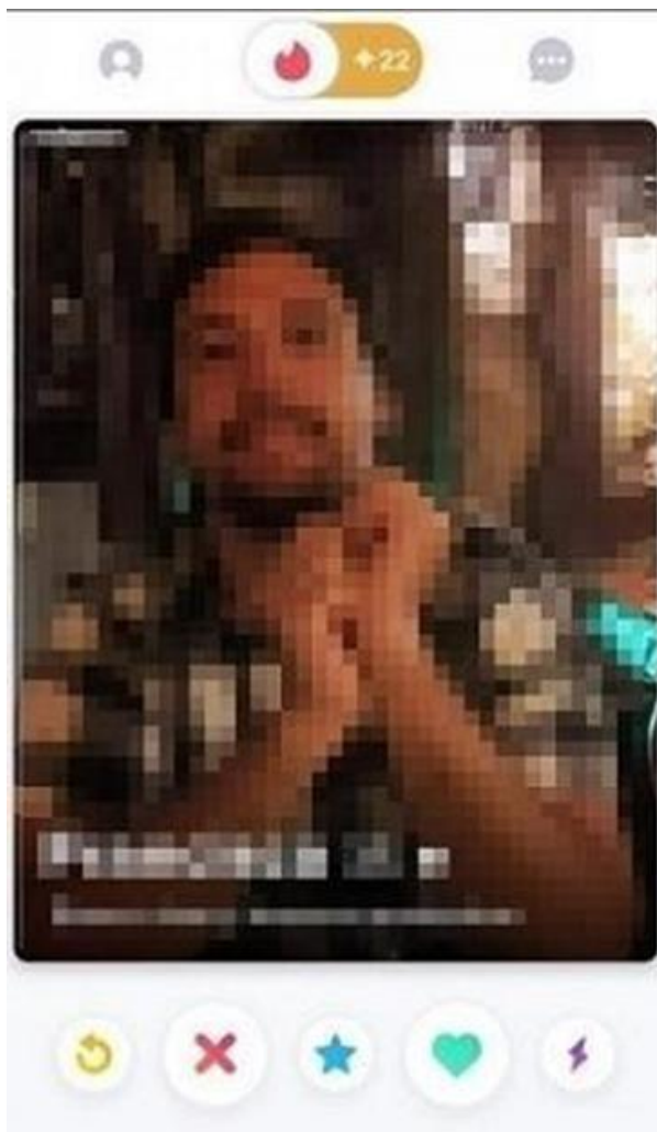
figura 3 - opciones de acción (2020) Captura de pantalla de la aplicación

cuentas falsas y rastrear su interacción con casi medio millón de perfiles, los varones tienden a seguir la primera estrategia, mientras que las mujeres prefieren la segunda.