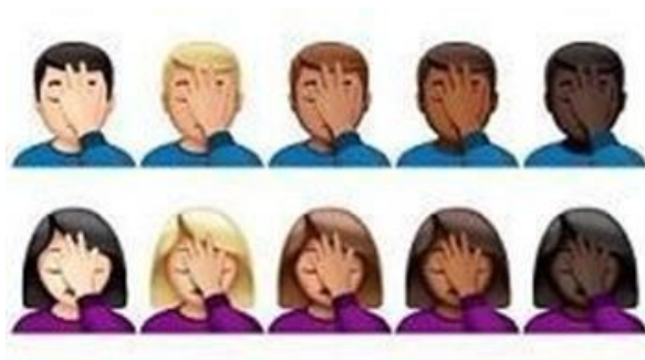
figura 4 - 'Facepalm' (2020) Emoji más utilizado en Tinder durante 2019

Tinder realiza una publicación anual llamada «Year in Swipe», donde se detallan algunas estadísticas sobre las tendencias más importantes de cada año. Las cifras se basan en las diferentes formas en que los solteros usan la aplicación, así como en la información que aportan en sus biografías. En 2019 la generación Z mencionó más veces causas o misiones que viajes en sus biografías, en contraste con los millenials, que se mostraron tres veces más propensos a hablar de viajes. Frases como «cambio climático», «justicia social», «el medio ambiente» y «control de armas» estuvieron en lo más alto de la lista de cosas que preocupan a la Z. Durante el año pasado, un emoji se convirtió en la estrella revelación que captó toda la atención: el «facepalm» (un aumento del 41 % en el uso de las biografías de Tinder).