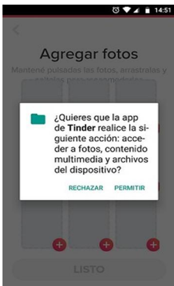
figura 1 - Permisos para configurar la cuenta (2020) Captura de pantalla de la aplicación

El último paso para la configuración del perfil está basado en la selección de una serie de imágenes (idealmente) propias, lo cual le da a la aplicación una predominancia de la imagen, aunque pueda incluirse una pequeña presentación que incorpora otros datos de información sobre el perfil creado sin llegar a ser tan relevante para las elecciones futuras.