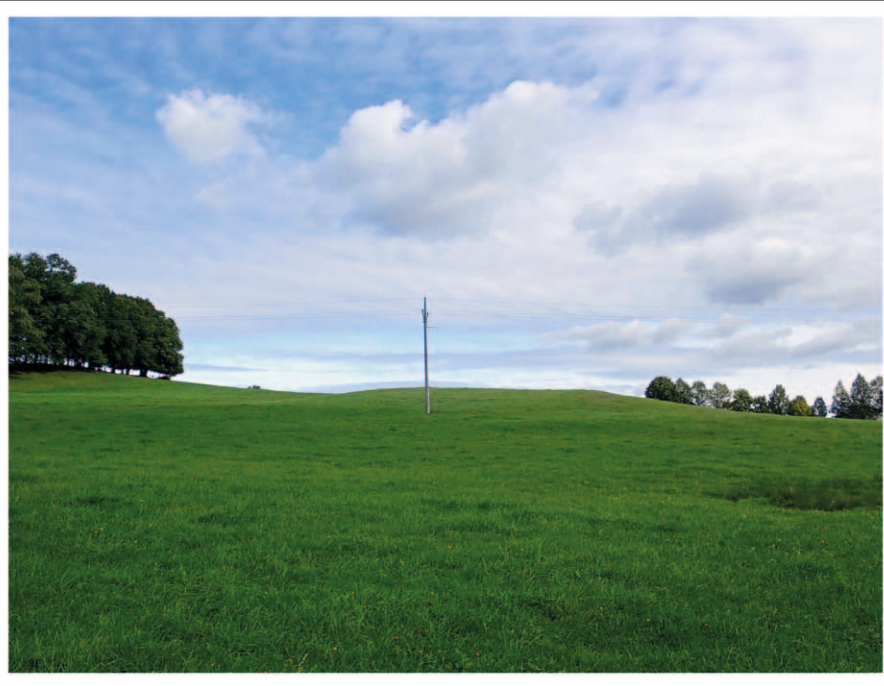
Obr. 2: Dobře patrná halda po blíže nedatované těžbě pelosideritu nad silnicí do Starého Zubří (d. b. MB057).

Zvláštní pozornost byla věnována lokalitě označené v historické mapě z počátku 19. století jako bývalý stříbrný důl (obr. 3). V tomto místě byly v závěru rokle pozorovány výchozy tmavošedého jílovce lhoteckého souvrství