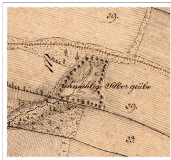
Obr. 3: Zákres údajného stříbrného dolu v historické mapě z r. 1810.

s ojedinělou 10cm polohou tmavošedého jemnozrného písčitého vápence s rozptýleným pyritem a hnědou zvětrávací kůrou. Mikroanalýza vzorku prokázala, že karbonátová složka je dominantně kalcitová. Mg-Ca siderit se vyskytl jako lokální příměs. Hornina obsahuje hojný pyrit, častěji ve formě framboidů a polyframboidů (obr. 4a, b) než homogenních krystalů a zrn (obr. 4c). Zcela výjimečně byl v jednom místě nalezen shluk nepravidelných zrn sfaleritu o velikosti do cca 2 μm (obr. 4d). Lokálně