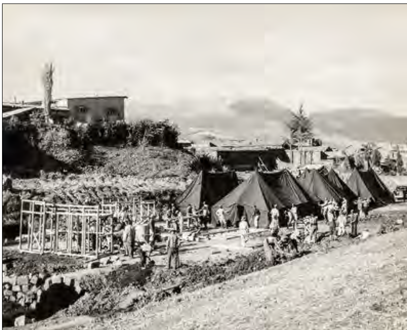
Imagen N° 5