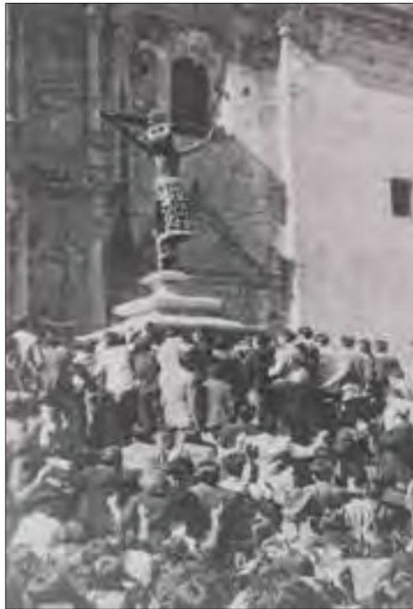
Imagen N° 4

Fuente: (Archivo Corporación LIFE) Fotografía de Elio Elisofon, 1950, editada por Jorge Sosa Campana, 2010.