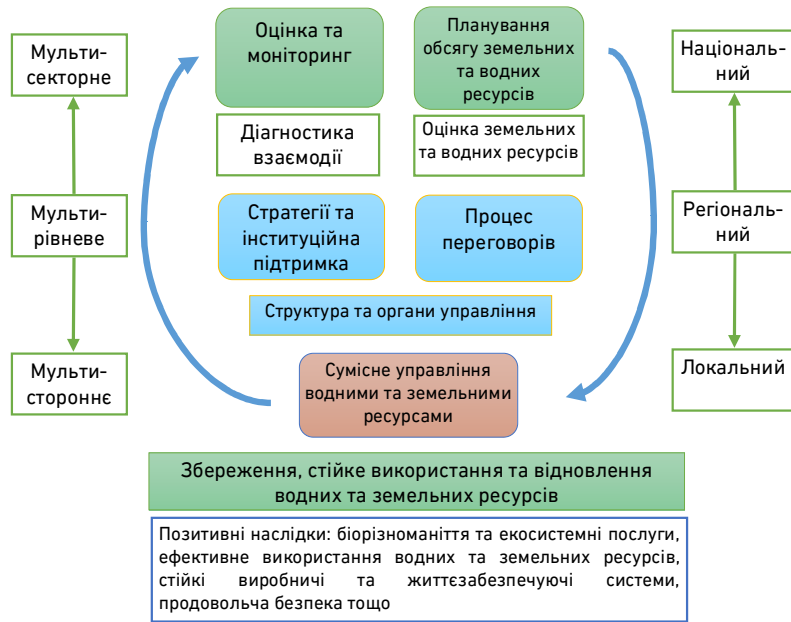
Рис. 1. Планування як складова процесу прийняття рішень при сумісному управлінні водними та земельними ресурсами (розроблено автором)

На нашу думку, для ефективного сумісного використання водних та земельних ресурсів, планування виступає однією із найважливіших складових процесу прийняття рішень (рис. 1).