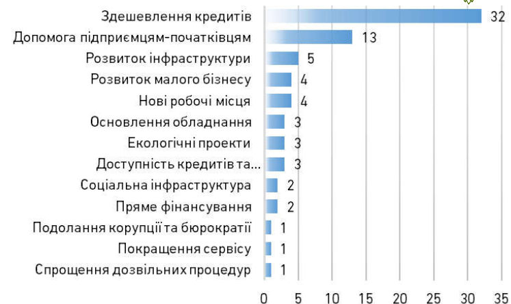
Рис. 3. Пріоритетні напрями фінансової підтримки бізнесу

Загалом 53% відповідей стосуються інструментів фінансової підтримки, які мають у своєму розпорядженні органи місцевої влади. Абсолютним пріоритетом серед інструментів фінансової підтримки є здешевлення кредитів (рис. 3).