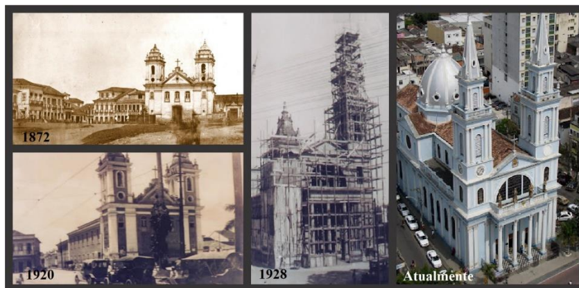
[Fig. 3] Evolução da Basílica Menor do Santíssimo Salvador – Historiar, 2009 1 ; 2017 1 . Modificado pela autora, 2022 - 7,86 x 15,94cm – Campos dos Goytacazes/RJ.

Cabe destacar que desde a sua instalação, como também por meio da evolução de sua construção através de diversos estilos arquitetônicos, até os dias atuais como parte do acervo neoclássico, essa obra transmite autoridade e representatividade junto ao meio que se situa, ou seja, na Praça Principal da cidade, conforme sua evolução demonstrada na Figura 3 .