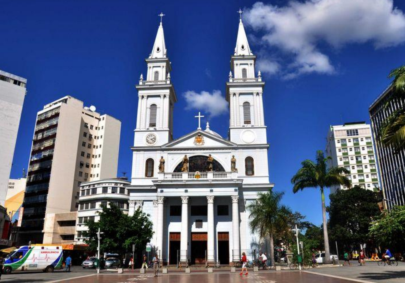
[Fig. 4] Basílica Menor do Santíssimo Salvador em estilo neoclássico - NF notícias, 2020 1 -10,57 x 15,93cm – Campos dos Goytacazes/RJ.

Nessa realidade, sua importância material e simbólica também reafirma as relações sociais desse local, de forma a transformá-lo em um “lugar de memórias” 62 e, assim, corroborar também com a sua valorização afetiva. Portanto, a Basílica Menor é responsável por resguardar e solidificar parte da memória campista, além de majorar o relacionamento do ser humano com o outro e com o meio. A memória é um produto da arte do relacionamento que permeia a Basílica Menor do Santíssimo Salvador e seu entorno imediato. Sejam essas relações do indivíduo com o próximo, ou desse com o meio. Logo, a memória representada por meio dessa Igreja é responsável por rememorar o passado e contextualizar o cidadão local com a sua história, onde através dessa reconstrução da memória se estabelecem significados e, portanto, se atribui a valorização por meio de vários aspectos.