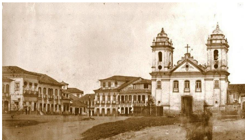
[Fig. 2] Igreja do Santíssimo Salvador em estilo Barroco – 1 - 9,03 x 16,05cm – Campos dos Goytacazes/RJ.

A composição de suas fachadas demonstrava o poder de Portugal sob a colônia, de maneira a denotar a territorialidade religiosa, econômica e política. Dessa forma, a até então Matriz da Villa de São Salvador (Campos) adquiriu sua nova sede em estilo barroco no ano de 1745, ao lado da Capela dos Passos 51 , conforme expresso na Figura 2 .