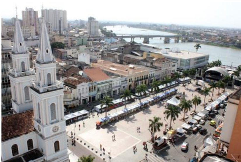
[Fig. 5] Basílica Menor do Santíssimo Salvador e o Rio Paraíba do Sul – 1 - 10,63 x 15,98cm – Campos dos Goytacazes/RJ.