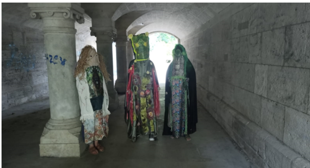
Imagem 4: Eu sou uma árvore . 2022. Alemanha.