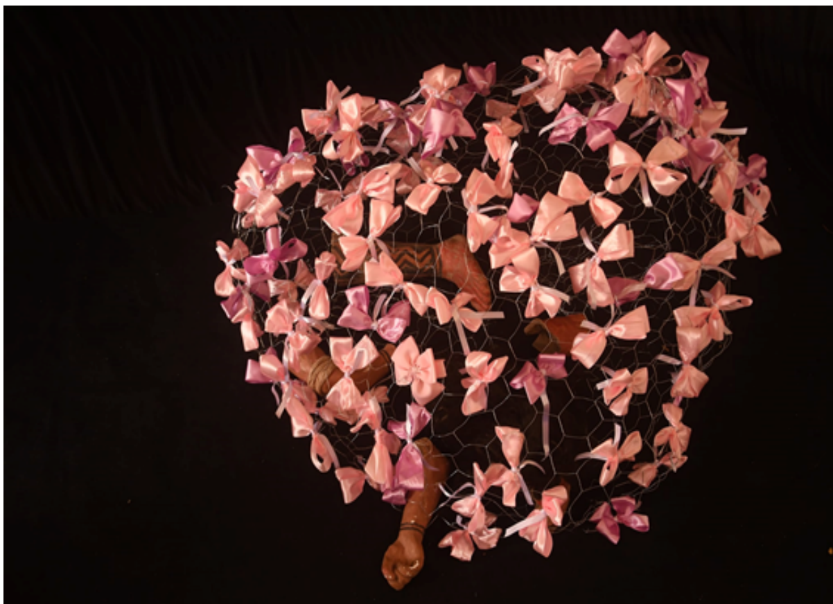
Imagem 3: Minha avó foi pega a laço. Instalação 2019-2022. São Paulo.