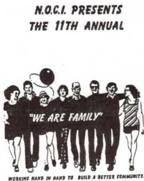
Imagem 3 – Anúncio para 11ª edição do piquenique de surdos LGBQIA+