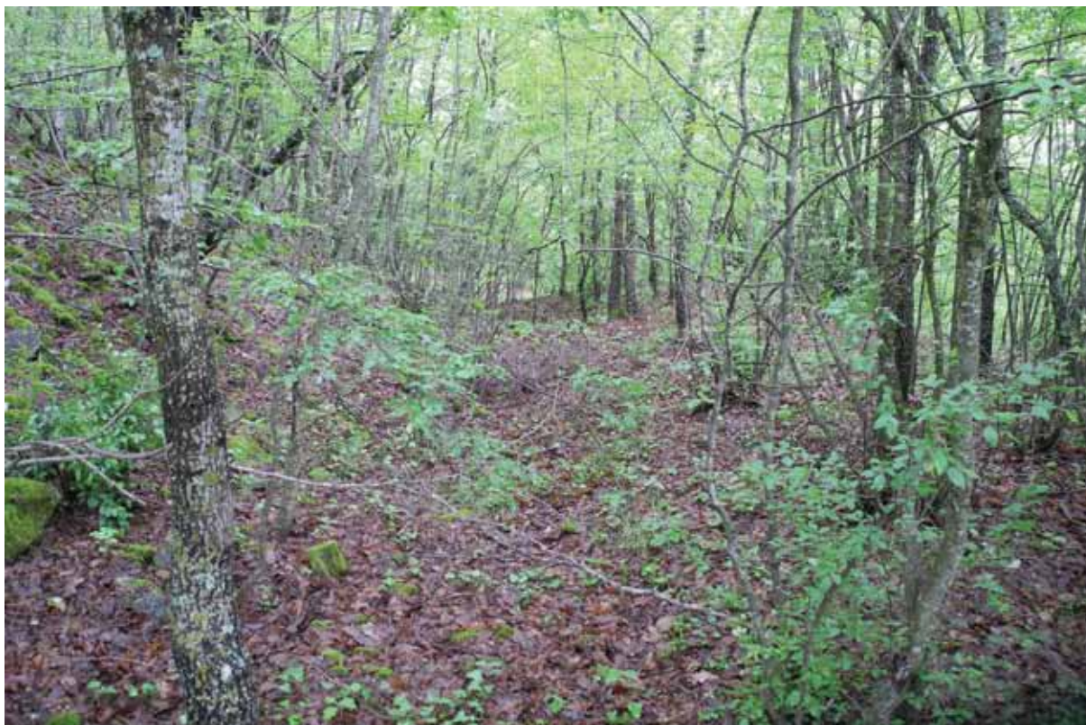
Slika 6 – Lece, Kulina, rov utvrđenja

Tokom rekognosciranja je izvršen i obilazak jedne utvrde u ovom kraju. Na visu severozapadno od Leca, iznad Lecke i Rudničke reke, nalaze se ostaci manjeg utvrđenja Kuline (Jerinin grad) koje dominira neposrednom okolinom. Utvrda je delimično zaklonjena okolnim visovima. Lokalitet je konstatovan 1977. godine, kada su otkriveni ostaci utvrđenja sa delimično očuvanim bedemima. Deo bedema je oštećen prilikom podizanja spomenika učesnicima NOB-a, kao i prosecanjem puta (Ерцеговић-Павловић, Костић 1988: 66–67). Utvrđenje, veličine oko 130 m x 50 m, nepravilnog je oblika i pruža se u pravcu zapad–istok. Njegova površina iznosi oko 0,3 ha. Utvrđenju se pristupalo sa severa, preko sedla koje je bilo branjeno rovom i palisadom (Sl. 6),