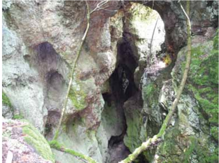
Slika 4 – Lece, Rasovača, kompleks galerija

Na južnim obroncima Rasovače nalazi takođe se niz pingi i okana. Posebo su važni ostaci kompleksa galerija (Sl. 4) i okana. Reč je o izuzetnim ostacima rudnika predrimskog, rimskog, srednjovekovnog i savremenog razdoblja. Tragovi predrimskog rudarstva se razaznaju po otiscima omekšavanja stene paljenjem vatre. Reč je o većim i manjim polukružnim i ovalnim udubljenjima u kojima se uočava oksidacija i ljušpanje stene. Središnji deo ovog kompleksa je probijen nizom ostataka galerija i okana, među kojima se vide i tragovi rimskih radova u vidu uredno isklesanih zidova. Za sada je teško reći nešto više o srednjovekovnom vađenju rude. S druge strane, savremena kopanja su išla dublje u potrazi za metalima, čime može da se tumači i potreba za probijanjem novog tunela sa istočne strane. Ako je suditi prema maloj količini izbačenog kamena i jalovine, ti radovi nisu bili intenzivni.