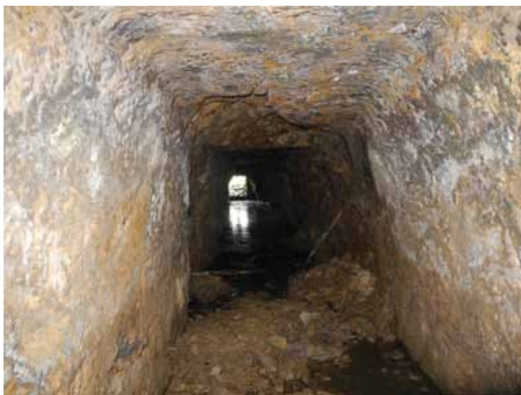
Slika 3 – Lece, Rasovača, rimsko okno