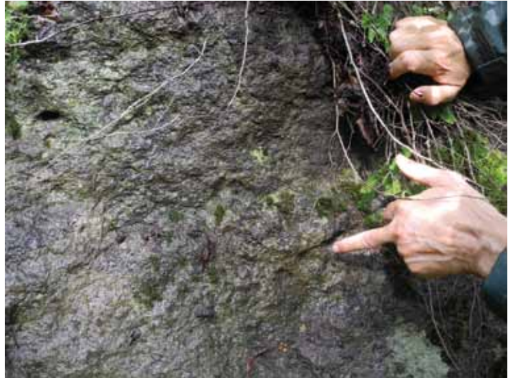
Slika 5 – Gornje Gazdare, Šuplji kamen, tragovi alata