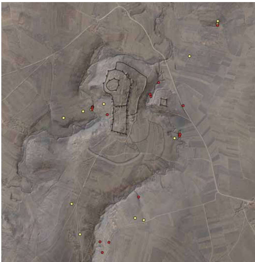
Slika 7 – Geološka ispitivanja u okruženju Caričinog grada: žuto – bušenje tla geosondom; crveno – geološki profili

Geološko rekognosciranje okoline Caričinog grada vršeno je da bi se dobila slika o infrastrukturnim zahvatima koji su morali da prethode izgradnji nove metropole u 6. veku, na mestu gde većih naselja i pratećih sadržaja pre toga nije bilo. Ispitivanja su imala za cilj definisanje zone krčenja šume za potrebe izgradnje i života grada, kao i potencijala zemljišta za poljoprivredu i opekarski i grnčarski zanat. Indikativne lokacije su birane pre početka terenskih radova, na osnovu lidarskog modela okoline Caričinog grada u kome se vide i tragovi erozije koja je najverovatnije nastala upravo usled deforestacije. Prikupljeni uzorci ugljenisanog drveta će, nakon što se izvrše C^{14} analize, omogućiti hronološko određenje tih radova. Potencijalna gliništa su ispitivana na mestu gde su ranije konstatovane opekarske reći (Иванишевић, Бугарски 2017: 59–60).