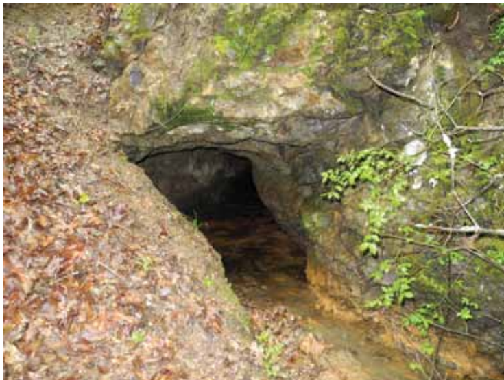
Slika 2 – Tulare, ulaz u okno br. 6

Tridesetih godina 20. veka bile su iskopane lateralne galerije a unutrašnjost ovog dela rudnika je bila proširena u velikoj meri. U tom delu su zatečene drvene konstrukcije zaostale od savremenih radova i izvlačenja jalovine i rude. Naposletku, na zapadnim padinama Rasovače se kao posebno značajni izdvajaju i ostaci pingi koje bi mogle da ukazuju na srednjovekovno rudarenje.