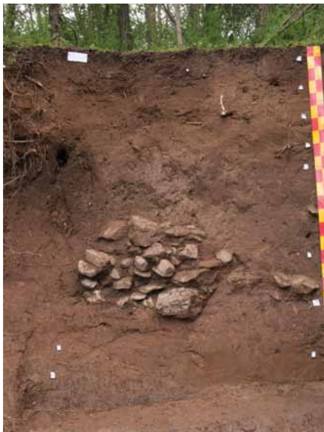
Slika 8 – Geološki profil CG E2

Na potesu Ševa livada (Šev zabel), severno od utvrđenja Sv. Ilija i asfaltnog puta, izvedeno je uzorkovanje geosondom (CG D1) i iz profila CG E1 postavljenog na jednom useku koji je, na rubu sadašnjeg šumarka, nastao usled krčenja šume na okolnom prostoru. Nešto dalje, na obali Svinjaričke reke, napravljena su tri geološka profila (CG E2-4) u zoni ranije dokumentovane peći za opeke (Sl. 8). Profili su postavljeni tako da se vide, i time datuju, sedimenti u koje je peć ukopana. Sama peć je bila postavljena na najvišoj tački, odakle je teren bio u padu i ka istoku i ka zapadu, što se vidi po dubini sloja sa ulomcima opeke u istočnom i zapadnom profilu. U profilu na oko 15 m istočno od profila peći, naišlo se na aglomeraciju kamena, uz poneku opeku. Pomalo nalik na presečeni zid, čini se da je aglomeracija bila postavljena na nekadašnju osnovu terena, koja je u 6. veku na ovom mestu bila znatno niže nego danas, nešto iznad kote šljunka na obali. Aglomeracija je, čini se, ili mlađa od peći, ili su istovremene. Mož-