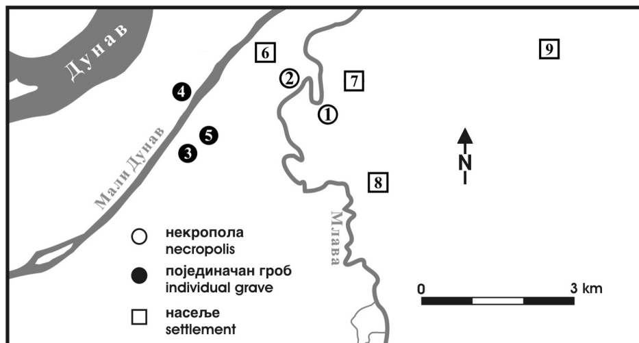
Сл. 1. Латенски локалитети у Старом Костолцу: 1. Пећине; 2. Рудине; 3. Репњак; 4. „Хумка“-Селиште; 5. Дунавац; 6. Тодића црква; 7. Чаир; 8. Дрмно-Над лугом; 9. Кличевачка Клепечка-Носак.