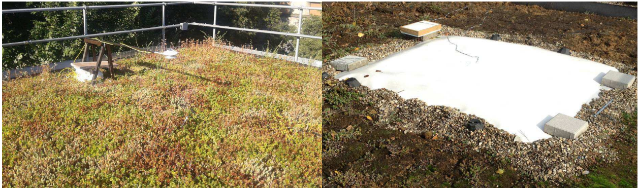
Figura 2. Copertura a verde in sedum su lapillo vulcanico, con l'albedometro posizionato sopra il campo (a sinistra); e membrana impermeabilizzante (albedo 0.77) con sonde di temperatura, sopra il terreno o sopra 6 cm di polistirene espanso estruso (a destra).

medesima membrana bianca è stata posizionata anche sopra 6 cm di polistirene espanso estruso, sempre equipaggiata con una sonda di temperatura superficiale. Per quanto concerne il tetto verde, la temperatura è misurata 2 cm al di sotto della vegetazione con una sonda a penetrazione, mentre l'albedo è misurata con un CMA 11 Kipp & Zonen.