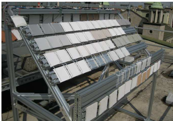
Figura 1. Telai con i campioni esposti presso il Politecnico di Milano.

In un primo esperimento, una selezione di materiali per gli strati di tenuta di coperture continue e discontinue, fra cui membrane impermeabilizzanti e tegole, è stata esposta nell'aprile 2012 sul tetto di un edificio del Politecnico di Milano, lontano da sorgenti specifiche di inquinamento (Figura 1). La loro riflettanza UV-Vis-NIR, fra 250 e 2500 nm, è stata misurata prima dell'esposizione e dopo 3, 6, 12, 18, 24, e 30 mesi con un Perkin Elmer Lambda 950, con una sfera d'integrazione di 150 mm di diametro. La riflettanza solare è stata quindi integrata secondo la norma ASTM E 903.