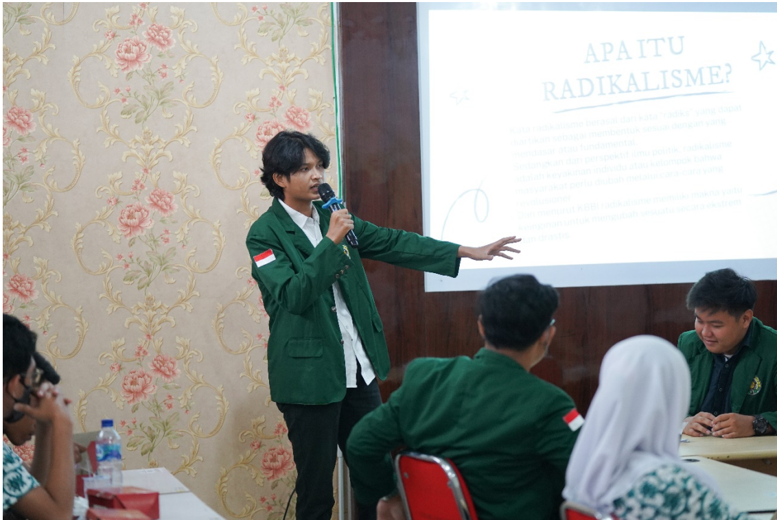
Gambar 3. Momen ketika salah satu mahasiswa memberikan materi terkait radikalisme

Sebelum masuk ke inti modul, panitia terlebih dahulu menyebarkan kuesioner kepada seluruh peserta. Soal-soal pretest diambil dari modul dengan komposisi masing-masing modul 5 pertanyaan. Dengan demikian total pertanyaan dalam kuesioner ada sebanyak 20 pertanyaan dengan bobot 5 poin jika benar dan 0 jika salah. Soal pretest dengan soal post-test dibuat serupa agar terlihat perbandingan antara kedua test tersebut. Hal ini dilakukan untuk melihat progress peningkatan pemahaman masing-masing peserta terhadap materi yang telah diberikan. Pre-test dilakukan untuk mengetahui pemahaman awal peserta sebelum proses sosialisasi dilaksanakan. Hasil pre dan pos test dapat dilihat pada tabel di bawah ini: