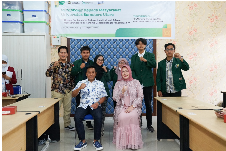
Gambar 5. Momen ketika Tim Pengabdian Masyarakat berfoto bersama Kepala Sekolah SMAN 1 Medan