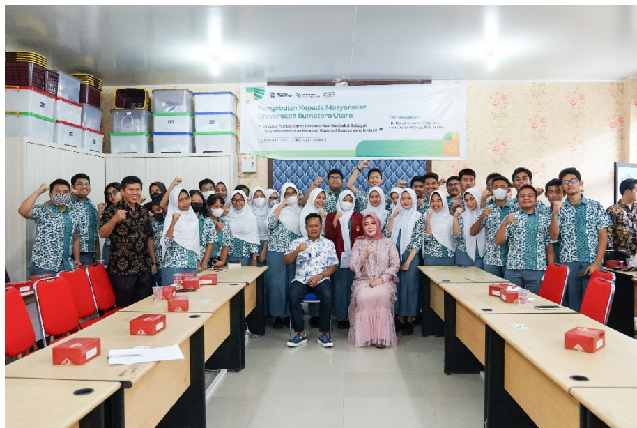
Gambar 6. Momen ketika Tim Pengabdian Masyarakat berfoto bersama Kepala Sekolah dan Peserta