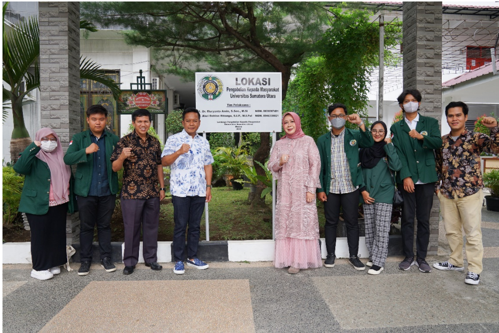
Gambar 7. Momen ketika Tim Pengabdian Masyarakat berfoto bersama Kepala Sekolah dan Mahasiswa di depan plang kegiatan