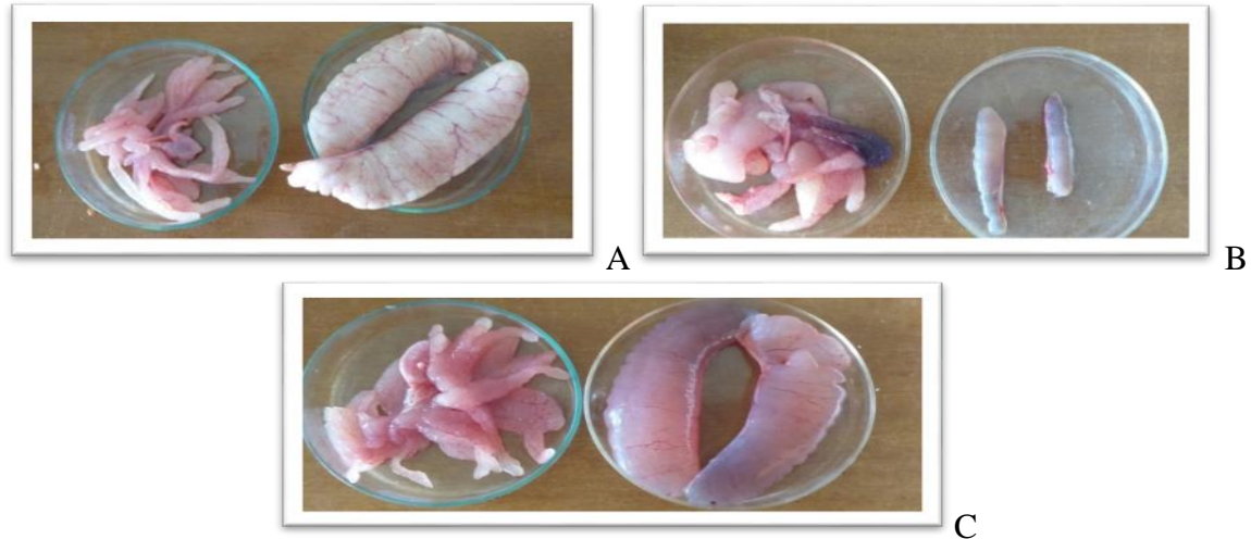
Figura 1. Testículos y vesículas seminales de reproductores de Clarias gariepinus : A. Testículos maduros tipo I, B. Testículos atrofiados y vesículas aumentadas de tamaño, C. Testículos asociados a mala calidad seminal (caso patológico).

En general, el ST obtenido en ambas épocas mostró color blanco y consistencia lechosa, aunque se evidenciaron muestras con consistencia cremosa en EPR; coincidiendo con los parámetros observados en épocas de no desove y desove en C. gariepinus silvestres (Ali et al. , 2022). El VST producido es elevado, consistente con los obtenidos en reproductores cultivados en Nigeria (17,69 ml); lo que indica que se requieren menos machos para fertilizar los huevos, debido a su abundante producción de semen (Jimoh et al. , 2021).