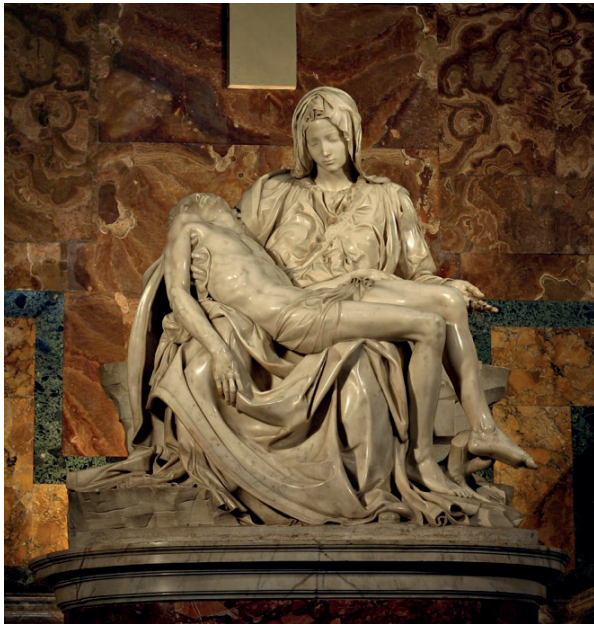
Figura 1. Pietà (1498/99), de Miguel Àngel Buonarroti

Nota: tomado de Wikimedia Commons, Stanislav Traykov, dominio público.