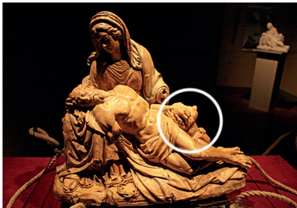
Figura 2. Modelo de la Pietà en terracota, con el cuerpo de Cupido

Nota: fotografía de José Miguel Hernández Hernández (www.jmhdezhdz.com). Círculo añadido.