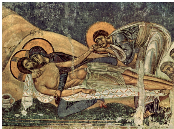
Figura 4. “Threnos” o “La lamentación por la muerte de Cristo” (1164), de Meister von Nerezi