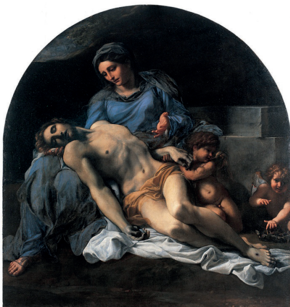
Figura 3. “Pietà” (1560-1609)”, de Annibale Carracci

Nota: tomado de Wikimedia Commons, Annibale Carracci, dominio público.