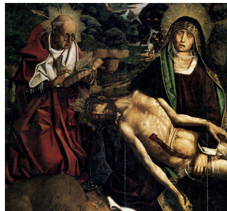
Figura 6. “Piedad del canónigo Desplá” (1490), de Bartolomé Bermejo