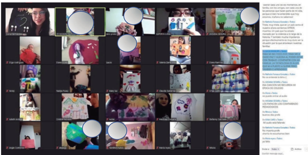
Figura 3. Ejercicios de arpillería como forma de reconocimiento y validación de las emociones y sentimientos en tiempos de pandemia

Desde las dos lógicas, el trabajo en equipo se convierte en fundamental para concertar, organizar y proyectar, así como para apoyar y comprender las situaciones que emergen durante la experiencia. El miedo, la conexión, las situaciones colectivas y particulares, las condiciones económicas complejas y la angustia hacen parte de las construcciones. Con base en el fragmento anterior puede afirmarse que se convierten, además, en impulso para avanzar y aportan de manera significativa a la formación (figura 3).