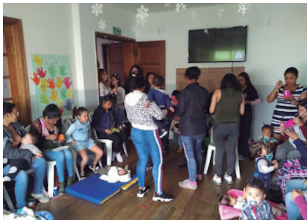
Figura 1. Taller en modalidad familiar. Interacciones entre los sujetos y el espacio