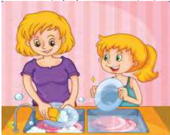
Görsel 3. Bulaşık yıkayan kadın ve kızı (s. 78)