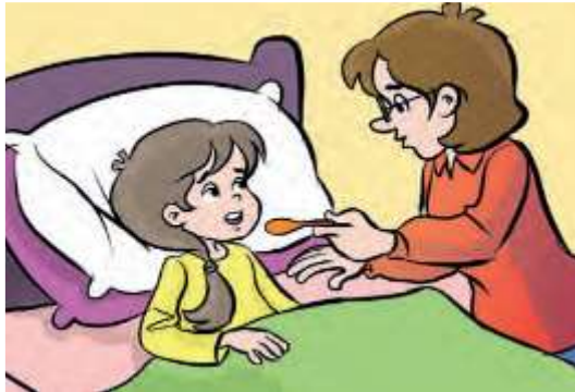
Görsel 1. Çocuğuyla ilgilenen bir anne (s.58)