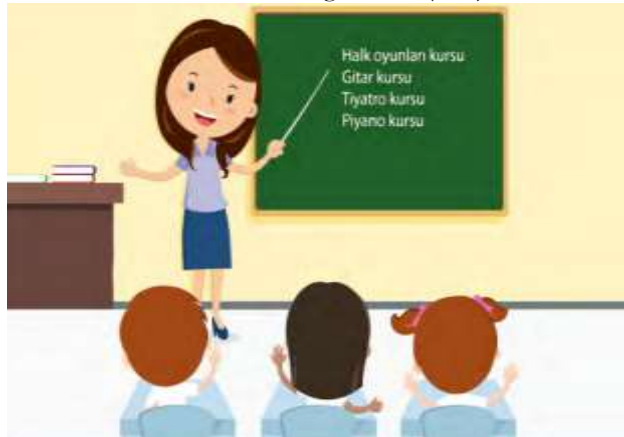
Görsel 5. Ders anlatan bir öğretmen (s.24)