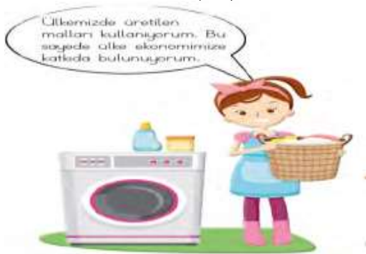
Görsel 7. Bir ev hanımı (s.76)