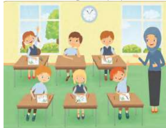
Görsel 6. Sınıfta bir öğretmen (s.62)