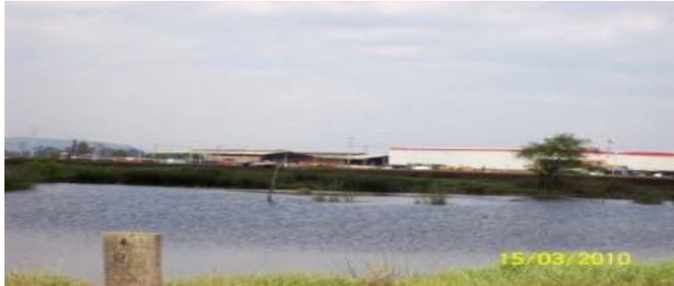
Humedal El Guali, marzo 2010