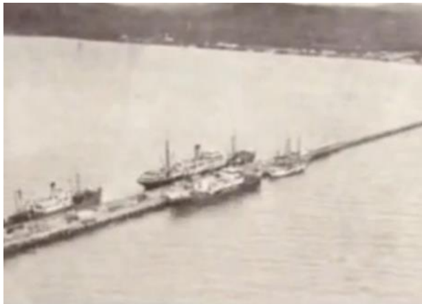
Benítez, R (s.f). Atraje de barcos en el muelle . Caída de una crónica anunciada.

No obstante, debido a la apertura del Canal de Panamá, el auge del comercio exterior y los intereses económicos de grandes empresarios tanto extranjeros como nacionales, se decidió llevar a cabo la ampliación del muelle, que para 1923 se convirtió en el tercero más largo del mundo, después de los muelles ingleses de South End y Southport. Lo triste de esta maravillosa historia de apertura económica para el país, fue el afán de dragar nuevamente las costas, ignorando por completo la tragedia natural que había advertido el Ingeniero Cisneros, si se llegara a explotar incontroladamente estos terrenos, lo que condujo a la desaparición de las franjas de tierra que hacían de las bahías de Puerto Salgar y Puerto Colombia excelentes refugios naturales protegidos de los vientos y las olas de altamar, a la vez que la costa se empezó a ver invadida de sedimento alejándose cada vez más del mar. (BLAA, s.f.).