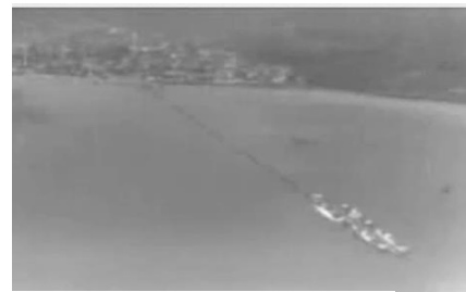
Ávila, J (s.f). Muelle - Puerto Colombia, Atlántico (años 1930)

Sin embargo la demanda y oferta de mercancía hacia 1878 era tan alta que el gobierno considero conveniente la construcción de un puerto terminal, que permitiera el atraque de buques de alto calado y para ello instauró un contrato con el Ingeniero Cubano Francisco Javier Cisneros, quien pretendía diseñar una estructura que lograra conectar a barranquilla con el mar Caribe, en su búsqueda