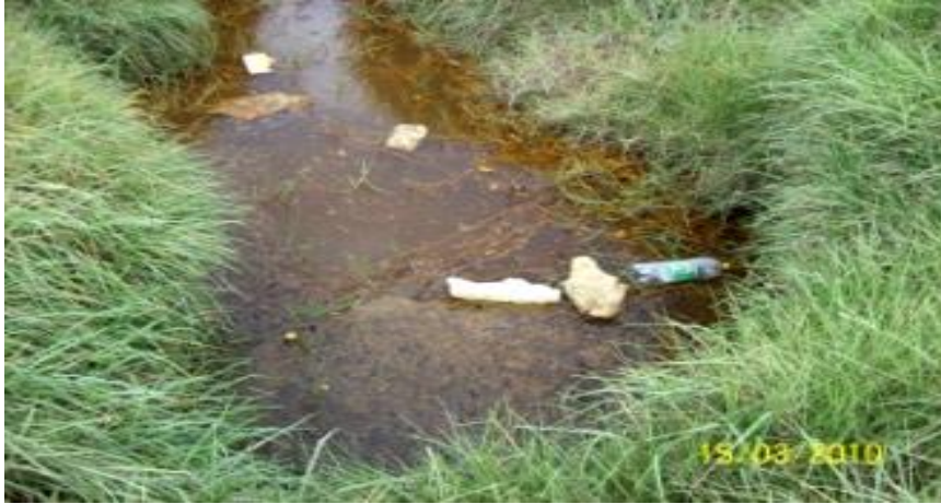
Desechos arrojados a orillas de El Guali marzo de 2010

De esta manera intento mostrar la influencia que tienen las percepciones, en las cosmovisiones de los grupos sociales, en donde la perspectiva individual, producto de la experiencia, cultura, ideología o historia, permite analizar la realidad que vive o percibe, cada sujeto, las cuales difieren de otras realidades sociales, pero que en ocasiones pueden tener similitudes conforme a las necesidades que tengan en común los individuos.