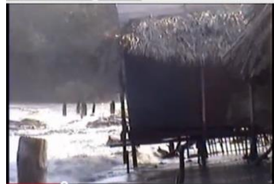
Puerto noticias (2012). casetas desmanteladas. Sector del Muelle

En consecuencia, se han desencadenado conflictos entre la administración del municipio y los residentes de las playas como pescadores y comerciantes, quienes se inculpan mutuamente por un problema de contaminación que viene desde los departamentos del Cauca y el Huila, donde nace el Rio Magdalena.