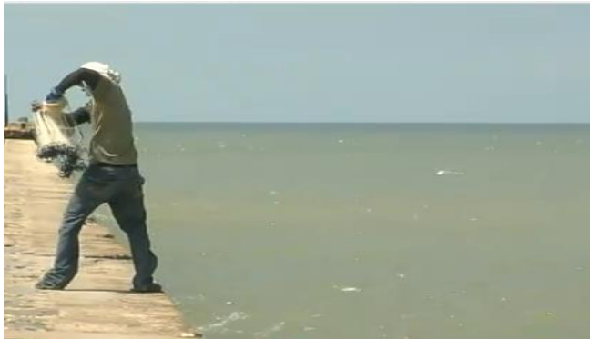
Osorio, C (2010). Pescando en el muelle. Documental viejo muelle querido.

La población más damnificada son los pescadores y dueños de casetas aledañas a las playas del municipio, quienes dependen de los pocos pesos que le deja el turismo en temporadas altas para el sostenimiento de sus familias. No obstante, y en vista de la situación de contaminación que los rodea, cada mañana deben recoger y cargar cuatro canecas o más de basura que arrastran las olas, entre los que se encuentran troncos, botellas, zapatos, latas de sardinas, jeringas e incluso bolsas plásticas medicas utilizadas para hacer diálisis (Bernal, 2011).