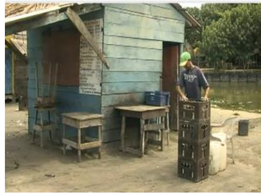
Osorio, C (2010). Caseta turística. Documental viejo muelle querido.

Es así, como los habitantes embellecen lo que queda de sus playas, o mejor esconden la realidad de la inmundicia en la que sobreviven, situación que empeora cuando el nivel y el fuerte oleaje del mar inunda y derriba las casetas instaladas por ellos mismos en estas áreas, siendo realmente preocupante y conmovedor escuchar la angustia de las familias que viven del turismo en Puerto Colombia, pidiendo clemencia a las autoridades para que se acuerden de ellos, y les den soluciones efectivas para contrarrestar este problema ambiental que los asecha y obliga a rebuscar su sustento de otras maneras.