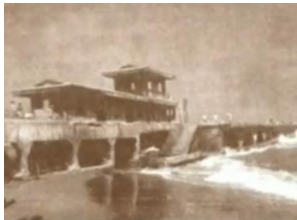
Benítez, R (s.f). Antigua Oficina de Aduanas . Caída de una crónica anunciada