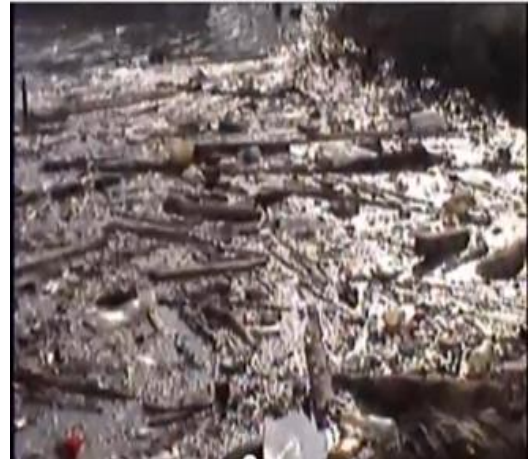
Puerto noticias (2012). Desechos arrastrados por las olas. Sector del Muelle

De este modo, para dar solución al problema ambiental ocurrido, no basta solamente con hacer jornadas ecológicas, ni conseguir recursos económicos o maquinaria para la limpieza de las playas, es necesario abordar el problema de contaminación desde su raíz, es decir de dónde nace el río hasta su desembocadura, involucrando así, a los departamentos que se benefician de éste y a las autoridades ambientales CAR (Corporaciones Autónomas Regionales) responsables del control, manejo y conservación de los recursos naturales de cada región.