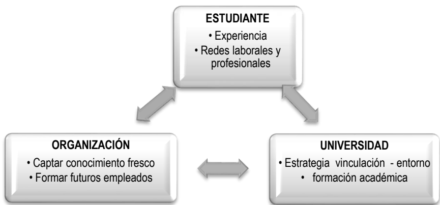
Figura 1. Propósito de las pasantías estudiantiles según actores involucrados

De esta manera, como se muestra en la Figura 1. Cada uno de los actores implicados en el desarrollo de las pasantías profesionales, tienen diferentes objetivos e intereses, aunque en definitiva su objeto sea mejorar los procesos institucionales y personales, para el beneficio común de estos actores.