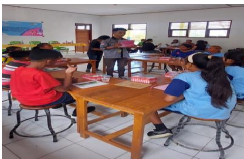
Gambar 3. Pelatihan kader posyandu remaja di SMP Negeri 1 Semau, Kabupaten Kupang, Nusa Tenggara Timur.

Kegiatan ini dihadiri oleh 10 siswa-siswi sebagai kader posyandu remaja. Dalam pelaksanaan kegiatan pertama-tama mempersiapkan lembar pretest, posttest dan juga media edukasi (lembar balik), setelah itu anak-anak tersebut mengisi kuesioner pretest yang telah disediakan, dan mulai melakukan literasi kesehatan reproduksi remaja untuk pelatihan kader posyandu remaja diakhiri dengan pengisian posttest untuk melihat tingkat pengetahuan kader posyandu remaja sebelum dan setelah diberikan literasi kesehatan reproduksi remaja.