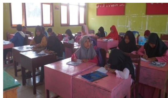
Gambar 3. Pre test mengukur kemampuan kosakata

Pre-test dilaksanakan beberapa hari sebelum kegiatan bimbingan. Jumlah peserta yang terlibat dalam pelaksanaan pre-test adalah sebanyak 15 siswa dari siswa kelas IV, kelas V, dan kelas VI. Tes keterampilan berbicara dilaksanakan dalam model percakapan Bahasa Inggris antara dua orang siswa. Siswa diberikan kesempatan untuk menentukan topik percakapan dan diberikan waktu sekitar 15 menit untuk mempersiapkan percakapan sebelum mulai melaksanakan pre-test. Selanjutnya, tes tulis tentang pemahaman vocabulary dilaksanakan satu hari setelah tes berbicara. Semua siswa terlihat tekun dan antusias dalam mengerjakan pre-test.