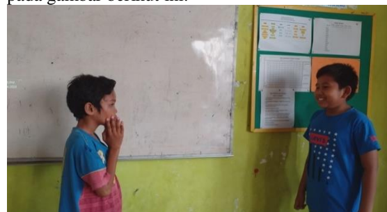
Gambar 2. Pre-test keterampilan berbicara

PKM dalam melaksanakan kegiatan bimbingan belajar Bahasa Inggris. Pre-test dilaksanakan dengan cara meminta siswa untuk melakukan percakapan dalam Bahasa Inggris secara berpasangan dan menjawab test tertulis vocabulary untuk mengetahui berapa banyak kosakata Bahasa Inggris yang dipahami siswa. Kegiatan pre-test berlangsung seperti pada gambar berikut ini: