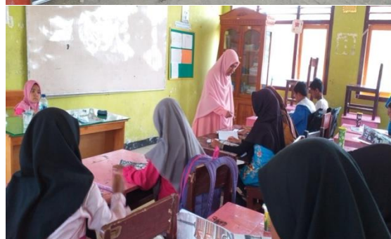
Gambar 4. Pembelajaran kosa kata Bahasa Inggris