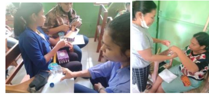
Gambar 9. Peserta sedang membuat kerajinan dari botol bekas

celengan, tempat pensil, gantungan dan sebagainya.