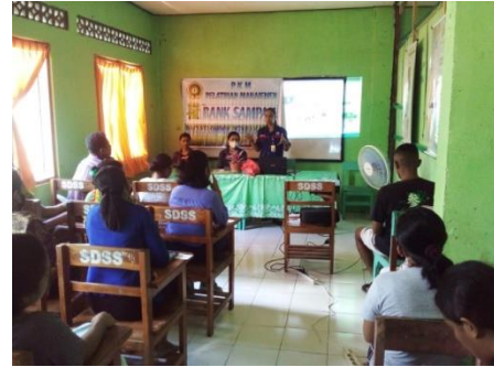
Gambar 5. Sosialisasi Bank Sampah oleh Narasumber

Tahap pertama yaitu sosialisasi tentang manajemen bank sampah, sosialisasi dilakukan oleh tim PKM. Sebelum dilakukan sosialisasi, peserta diberikan kuesioner yang berisi beberapa pertanyaan tentang apa itu sampah organik dan anorganik, bagaimana cara pemilahan sampah, apa itu bank sampah, bagaimana mekanisme bank sampah.