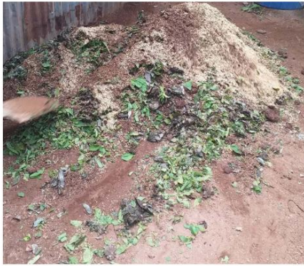
Gambar 6. Bahan pupuk yang dicampur