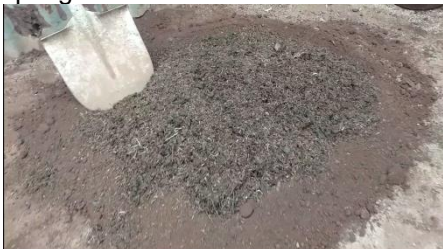
Gambar 8. Pupuk yang sudah siap digunakan