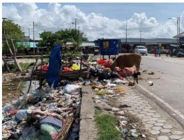
Gambar 1. Timbunan sampah di Kelurahan Oesapa

Peningkatan jumlah penduduk perkotaan yang cepat mengakibatkan tingkat konsentrasi aktifitas perkotaan semakin tinggi. Wilayah permukiman pesisir kota kupang meliputi daerah seluas 22,7 km 2 , meliputi wilayah Kecamatan Kelapa Lima dan Kecamatan Alak. Penduduk yang bermukim di wilayah tersebut pada umumnya bekerja sebagai nelayan. Permukiman di wilayah tersebut berkembang dengan cepat seiring dengan berkembangnya kota kupang sebagai Ibu Kota Propinsi Nusa Tenggara Timur (Roni 2010).