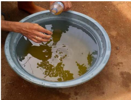
Gambar 7. Campuran air, molase dan eco enzym