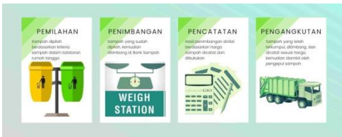
Gambar 2. Mekanisme Bank Sampah

menjelaskan bahwa pengembangan bank sampah ini juga akan membantu pemerintah lokal dalam pemberdayaan masyarakat untuk mengelola sampah berbasis komunitas secara bijak dan dapat mengurangi sampah yang diangkut ke Tempat Pembuangan Akhir (TPA) (Winarso 2011). Inovasi pengolahan sampah dengan program bank sampah menjadi inovasi di tingkat akar rumput yang dapat meningkatkan pendapatan masyarakat miskin perkotaan (Administrator 2020).