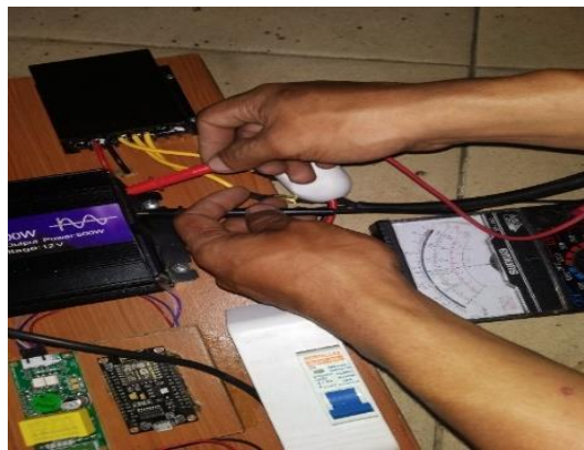
Gambar 7. Pengukuran Inverter

e. Daya Pengukuran Inverter, seperti terlihat pada Gambar 7.