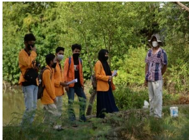
Gambar 9. Pendampingan terhadap mitra untuk menjelaskan pengoperasian teknologi.

Proses pendampingan yang dilakukan terhadap mitra petani tambak dapat dilihat pada Gambar 9.