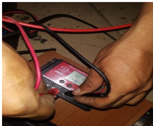
Gambar 6. Pengukuran SCC

Pada pengukuran Kontroller Solar Cell 12 V/20 A ini menggunakan Avometer dengan melakukan pengukuran voltase (V) dan Ampere (A) DC dengan mengukur tegangan dan arus input sebelum masuk kontroller kemudian mengukur tegangan dan arus output yang dengan menggunakan rumus V \times I untuk mengetahui output daya yang dihasilkan setelah melalui kontroller dengan tujuan memeriksa dan mengetahui kinerjanya, berdasarkan hasil pengukuran diperoleh data, seperti terlihat pada Tabel 5.