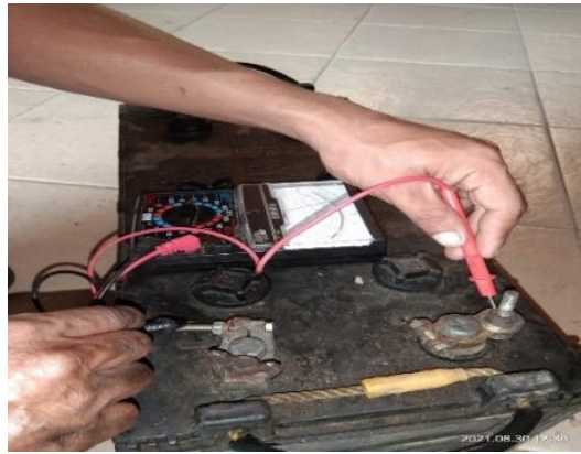
Gambar 8. Pengukuran Battery

Pada perancangan teknologi hybrid ini menggunakan beban battery 100 Ah/12 V sehingga apabila pengisian penuh dapat menyimpan daya sebesar 1200 Wh. Dengan perhitungan efektifitas 85% maka battery dapat menyimpan daya sebesar 1.020 Wh. Dengan beban lampu 30 watt sebanyak 2 biji dan pompa air 125 Watt, maka pada perancangan ini battery dapat digunakan selama 30 menit. Untuk pengisian battery oleh panel surya 200watt menggunakan rumus sebagai berikut: Lama Pengisian Battery= Ah Battery: Ampere (ISC) = 100 Ah: 11,56 = 8 jam 45 Menit.