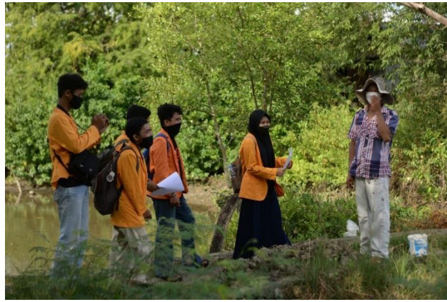
Gambar 1. Foto Lokasi Pendampingan terhadap mitra terkait penerapan teknologi tepat guna Teknologi Hybrid Solar Cell dan Turbin Angin dengan Sistem Berbasis Data Logger

Salah satu masalah yang dihadapi petambak udang tradisional adalah kualitas tambak yang tidak memadai disebabkan oleh akses dan kebutuhan listrik tidak terpenuhi (Dewi, 2020; Sukoco et al., 2018). Tersedianya sumber listrik pada tambak udang tradisional tersebut, membuat berbagai macam teknologi bisa diterapkan untuk meningkatkan kualitas dari tambak tersebut. Ketersediaan energi listrik akan berpengaruh terhadap peningkatan hasil produksi tambak seperti menambahkan aerator untuk meningkatkan kadar oksigen pada tambak (Nugraha et al., 2020), menjaga produktivitas dan memberikan sistem penerangan pada tambak untuk menerangi area keliling tambak sehingga memudahkan pemberian pakan pada malam hari serta keamanan tambak.