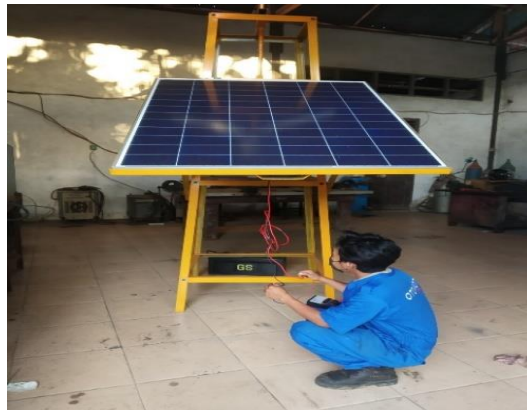
Gambar 3. Pengujian Panel Surya

Pada pengukuran Solar Cell 12 V/200 Wp ini menggunakan Avometer dengan melakukan pengukuran voltase (V) dan Ampere (A) DC kemudian dilakukan perhitungan menggunakan rumus V \times I untuk mengetahui output yang dihasilkan pada panel surya yang dilakukan secara berkala periodik dengan temperature yang berbeda setiap waktu. Berdasarkan hasil pengukuran tersebut diperoleh data, seperti terlihat pada Tabel 2.