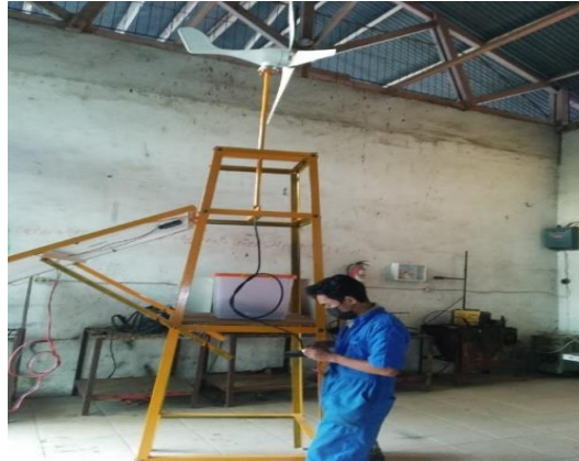
Gambar 4. Pengujian Turbin Angin

Pada pengukuran Turbin Angin 12 V/ 400 Watt ini menggunakan Avometer dengan melakukan pengukuran voltase (V) dan Ampere (A) dengan menggunakan rumus V \times I untuk mendapatkan output berupa daya listrik yang dihasilkan berdasarkan hasil pengukuran kecepatan angin menggunakan Anemometer sehingga diperoleh hasil pengukuran, seperti terlihat pada Tabel 3.