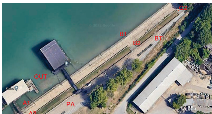
Slika 1. Područje istraživanja: A) uzvodno od ispusta (OUT); B) i C) nizvodno od ispusta; PA) šetalište; BT) biciklistička staza

Istraživanje je rađeno u maju 2022. godine na Savi. Područje istraživanja je prikazano na Slici 1. Ono obuhvata potez između novog i starog železničkog mosta, od 3. do 2.7 rkm, gde se nalazi jedan od većih ispusta otpadnih voda na teritoriji grada Beograda (prosečni protok od 94.250 m 3 otpadnih voda/danu). Područje je zanimljivo i po tome što pristup samom ispustu (OUT - na slici) nije ni na koji način ograničen, iako se nalazi u neposrednoj blizini rekreativne zone (biciklistička (BT) i pešačka staza (PA)). Na splavovima na mestu samog ispusta se nalaze ugostiteljski objekti, a područje je veoma zanimljivo i za sportske ribolovce. Na odabranom potezu, ispitivana su su tri mikro-lokaliteta: (A) uzvodno od ispusta (OUT) i (B, C) nizvodno od ispusta.